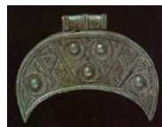
Образцы женских украшений Древней Руси