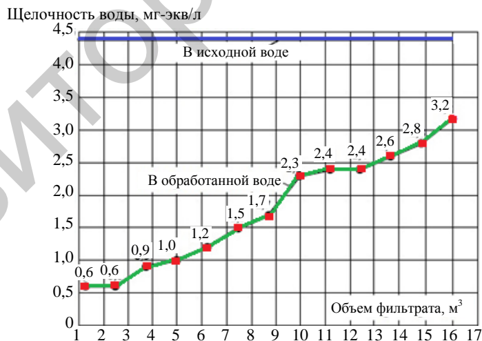
Рис. 2. Изменение щелочности обработанной воды в зависимости от величины объема фильтрата

Аналогичные результаты получены также при загрузке фильтра анионитом АВ-17-8. При загрузке анионитом АВ-17-8 остаточное значение бикарбонат-ионов получилось на 10–15 % меньше, чем при анионировании воды на анионите Purolite A200EMBCl. Соответственно и рабочая обменная емкость поглощения анионита АВ-17-8 оказалась больше, чем у анионита Purolite A200EMBCl.