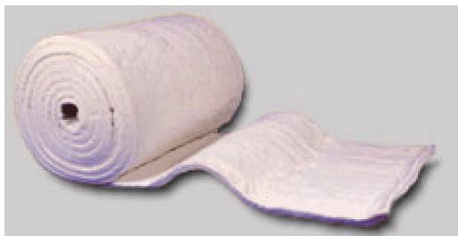
Рис. 4. Маты из керамоволокнистого полотна