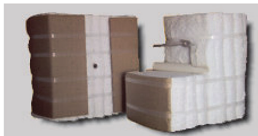
Рис. 5. Керамоволокнистые модули

К таким материалам относятся керамоволокнистые сборные футеровки в виде плит, матов (рис. 4) или модульных блоков (рис. 5) с температурой применения до 1400 °С. Легковесные футеровки достаточно просто монтируются, обладают низкой плотностью, малой инерционностью и теплопроводностью. Они абсолютно устойчивы к тепловому удару при резких колебаниях температуры.