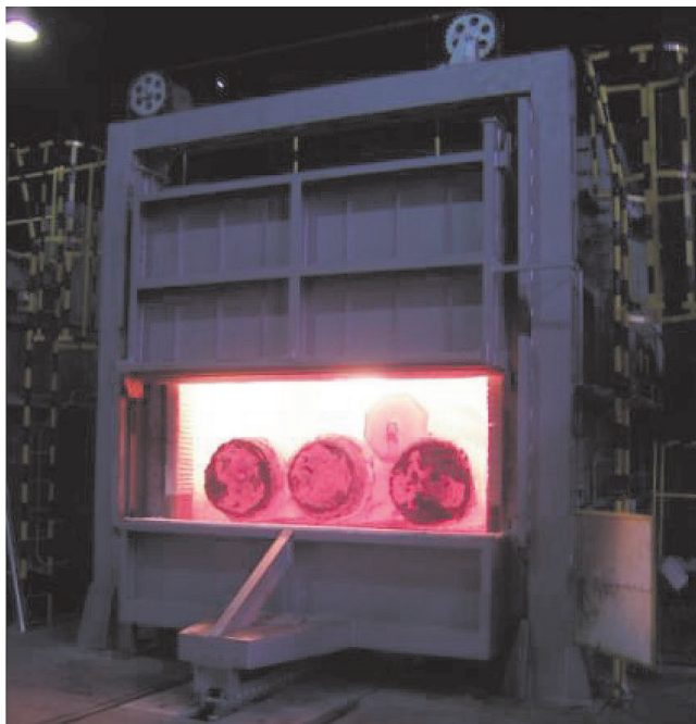
Рис. 1. Стенд для сушки и разогрева ковшей

Большую долю в деятельности компании занимают производство, реконструкция и восстановление термических печей различного назначения, установок нагрева штампов непосредственно в прессах, стенов сушки и нагрева ковшей, сушильных печей, горелок для нагрева кромок перед сваркой и других агрегатов для металлургического, кузнечного и литейного производств.