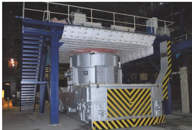
Рис. 2. Печь с выкатным подом для разогрева слитков