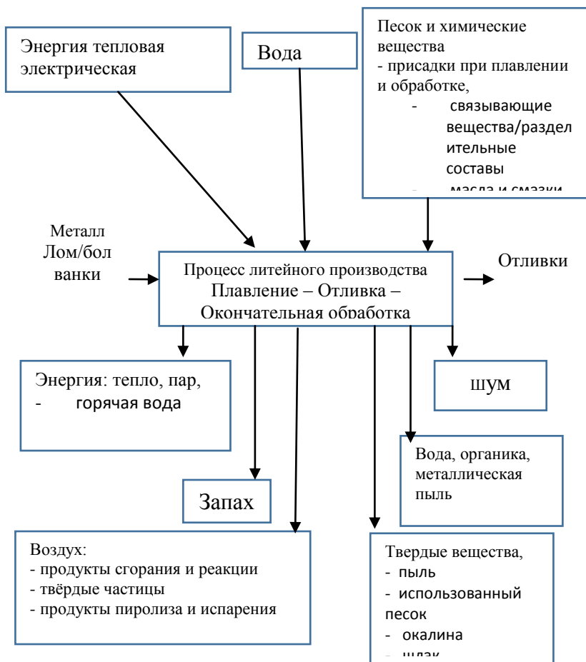
Рисунок 2 – Схема материального баланса для литья серого чугуна

различие между условиями топочных газов ниже и выше нее, потому что через завалочное окно проникает окружающий воздух [3].