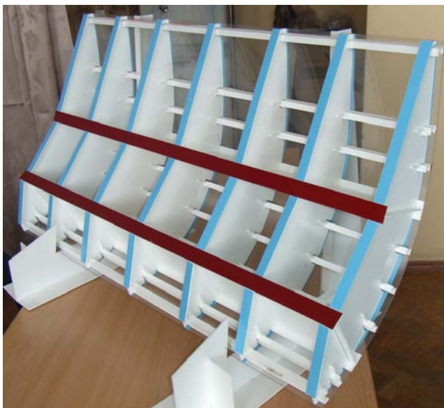
Рисунок 1 – Макет гидротехнического сегментного затвора

Поперечное сечение пролетного строения сегментного затвора представляет собой сегмент окружности, центр которой обычно совпадает с осью вращения затвора. Сегмент опирается на ноги, через которые давление передается на шарниры. Опорные шарниры закрепляют на боковых стенках водопропускного отверстия. Гидростатическое давление воды передается на обшивку, далее на стрингеры, диафрагмы и ригели.