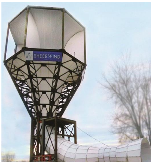
Рисунок 3 – Ветроустановка INVELOX

В отличие от других турбин, новинка может похвастаться минимальным уровнем негативного воздействия на экологию и на животный мир. Кроме того, ветряк INVELOX отличается относительно низкой стоимостью. По словам представителей SheerWind, эксплуатация этого энергоблока вполне может быть прибыльной даже без государственных субсидий. Все эти качества позволяют INVELOX революционизировать сектор возобновляемой энергетики в самое ближайшее время.