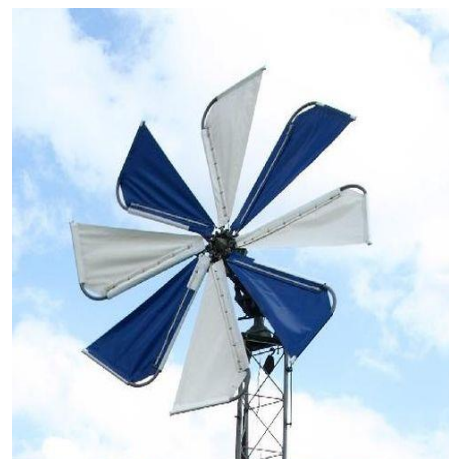
Рисунок 2 – Ветрогенераторы с жесткими и парусными лопастями