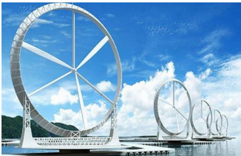
Рисунок 4 – Ветроустановки выполненные по технологии «Воздушная Линза»

В настоящее время быт человека во многом зависит от энергоспособности государства и обеспечения электроэнергией населения. Для крупных потребителей электроэнергии существуют АЭС, ТЭЦ, ГЭС, которые обеспечивают многонаселённые пункты, сельское хозяйство и промышленность. Но до сих пор остаются населённые пункты, которые не имеют устойчивого электроснабжения. Наиболее острая проблема связана с электроэнергией, так как, чтобы обеспечить электроэнергией район, требуется много