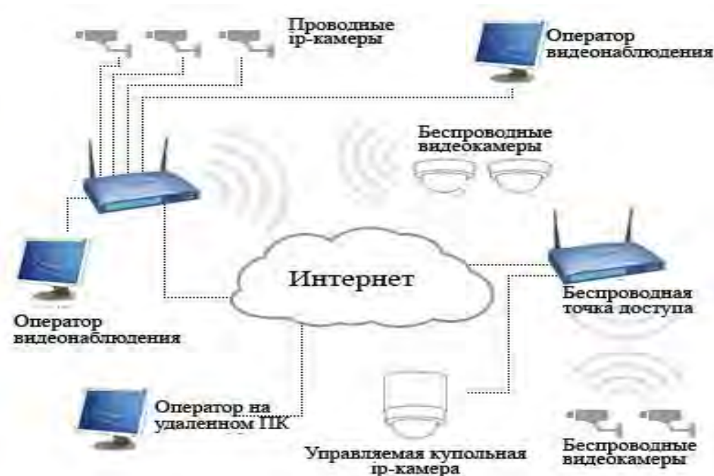
Рис. 3. Принцип работы системы IP-камер

На рис. 3 приводится принцип функционирования системы IP-камер.