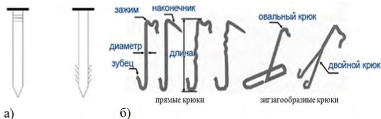
Рисунок 1 – Крепежные элементы: а) гвозди, б) крюки

стали. Оба эти метода обеспечивают хорошую долговечность кровли, порядка 100 лет.