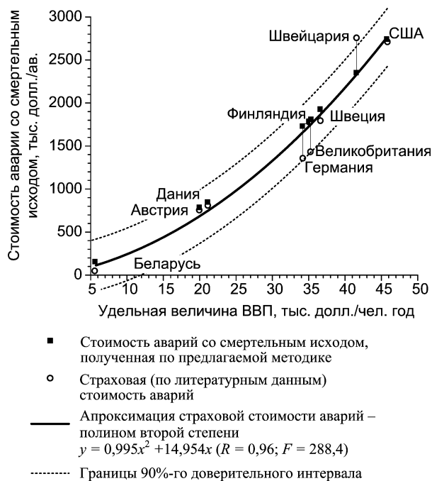
Рис. 2. Зависимость стоимости аварий со смертельным исходом от удельной величины ВВП.