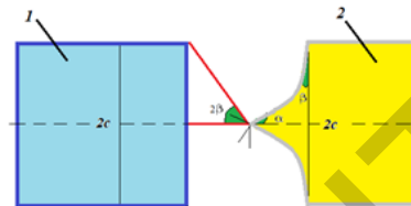
Рисунок 5 – Конструкция ультразвукового устройства с ОПВ, граница контакта передней грани призмы которого с подложкой выполнена в виде двух ветвей параболы: 1 – излучающий ПЭП; 2 – ОПВ

Учитывая полученные данные, проведен расчет и предложена оптимальная конструкция ОПВ, существенно нивелирующая (~35 дБ и более) влияние шумового фона, на ультразвуковые измерения свойств поверхности. На рисунке 5 приведена одна из предложенных конструкций ультразвукового устройства с ОПВ, где граница контакта передней грани призмы с подложкой выполнена в виде двух ветвей параболы.