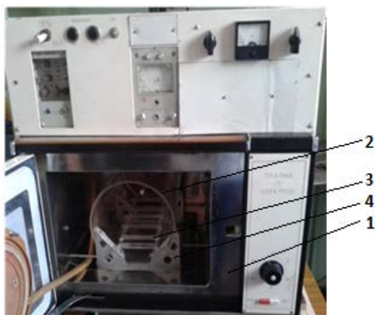
Рисунок 1 – СВЧ плазматрон резонаторного типа

Основными элементами установки являются: корпус, генератор электромагнитных колебаний, резонатор прямоугольной формы 1 с горизонтально размещенным в нем кварцевым реактором 2 на подставке 4, источник питания СВЧ магнетрона, система газоснабжения, электрооборудование с системой управления и контроля. Внутри кварцевого реактора размещается подложкодержатель 3. В качестве генератора электромагнитных колебаний использовался магнетрон М-105, величина мощности которого достигает 600 Вт и частоты – 2,45 ГГц.