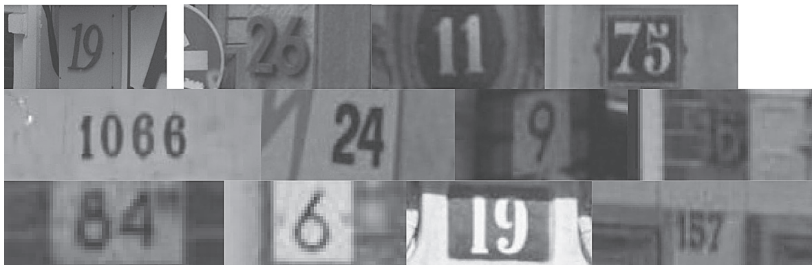
Рис. 2. Примеры изображений из базы SVHN