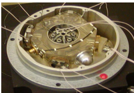
Рисунок 1 – Внешний вид КЛ

Одной из основных подсистем электронного обеспечения ЦМЛГ формирует частотную подставку для создания невзаимности встречных волн в резонаторе кольцевого лазера (КЛ) (рисунок 1).