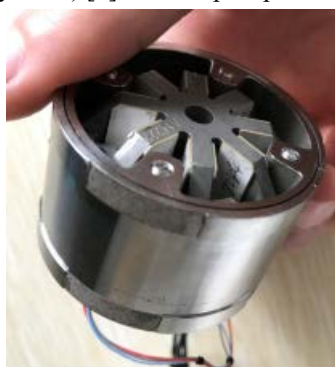
Рисунок 2 – Виброподвес КЛ

Эта подсистема подключается к виброподвесу (ВП) (рисунок 2) [2], на котором размещается КЛ.