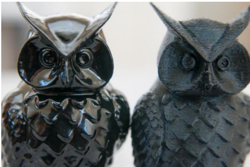
Пример гляцевания поверхности ацетоном.

Под конец мы решили полностью пройти производственный процесс и покрыть заглушку лакокрасочным покрытием. Выбранный в качестве материала абспластик не только обладает повышенными прочностными характеристиками но и весьма благоприятен к обработке, по этим же причинам его используют автопроизводители для производства бамперов и элементов интерьера. Мы покрасили матовой акриловой краской без применения грунта. По лакокрасочное покрытие итогу, очень хорошо легло на поверхность скрыв мелкие недочеты и огрехи в виде царапин и переходов между слоями.