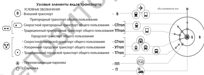
Рисунок 3 – Классификация транспортно-пересадочных узлов применительно к Новосибирской агломерации

Особенности каждой группы представлены в таблице 1.