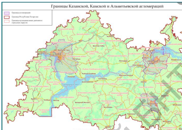
Рисунок 3 – Карта-схема уточненных границ Казанской, Камской и Альметьевской агломераций

Карта-схема на рисунке 3 и расчёты, приведённые в таблице ниже, иллюстрируют ещё один срез в рассмотрении формирующихся на текущий момент агломераций. При проведении исследования было выявлено наличие устойчивых корреспонденций по трудовым целям вне основных городов-центров Камской и Альметьевской агломерации, что может свидетельствовать об их возможном полицентрическом развитии. Для Камской агломерации такими будущими под центрами могут стать Нижнекамск и Елабуга, а для Альметьевской агломерации – Лениногорск и Бугульма.