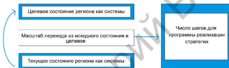
Рисунок 1 – Определение числа шагов по реализации стратегии в зависимости от гар-анализа между целевым и текущим состоянием системы

агломерации или имеющие агломерационный потенциал. Как правило, существует недостаток исходных данных для обоснованных выводов о вышеизложенных процессах или, по крайней мере, для формирования гипотез. Те возможности и объемы данных, которые уже давно используются в развитых странах для решения подобных задач, стали доступны в России всего лишь два-три года назад. Речь идет о применении «больших данных» по нагрузке на сеть сотовых операторов. Термин «большие данные» подразумевает не только объем и разнообразие информационных ресурсов, которые подаются на «входе» для обработки, но применение инновационных технологий обработки, требующих участия команд специалистов разной специализации.