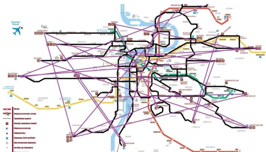
Рисунок 1 – Связи по воздушной линии маршрутов трамвая Праги

Но и здесь мы видим два существенных отличия в работе трамвая в городах Европы. Ряд городов использует трамвай для связи отдаленных районов через центр с помощью диаметральных и двурадальных маршрутов. Яркий пример этому является трамвай города Праги. Здесь маршруты трамваев проходят от одного периферийного района города к другому через центр (рисунок 1). Фактически трамвай в таких городах как Прага, обслуживает те районы, в которых нет метро. Это направления с меньшим пассажиропотоком, чем метрополитен, но также требующим обслуживания жителей районов с высоким уровнем качества.