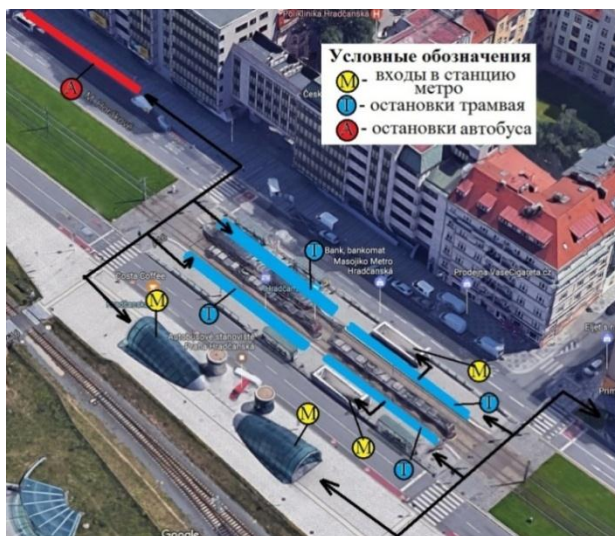
Рисунок 3 – Схема транспортно-пересадочного узла в Праге

Города постсоветского пространства в большей мере использовали беспересадочную схему маршрутов общественного транспорта. В этой связи развитие транспортно-пересадочных узлов шло крайне медленными темпами. Это наследие советской системы перешло как в городах Российской Федерации, так и в города Прибалтики, которые на данный момент входят в Европейский союз.