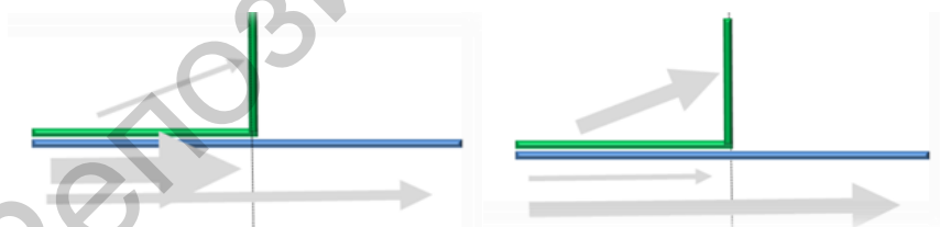
Рисунок 8 – Корреспонденции – база для задач расписания

Еще один аспект анализа дублирования пассажирских корреспонденций – подготовка задач для составления расписания.