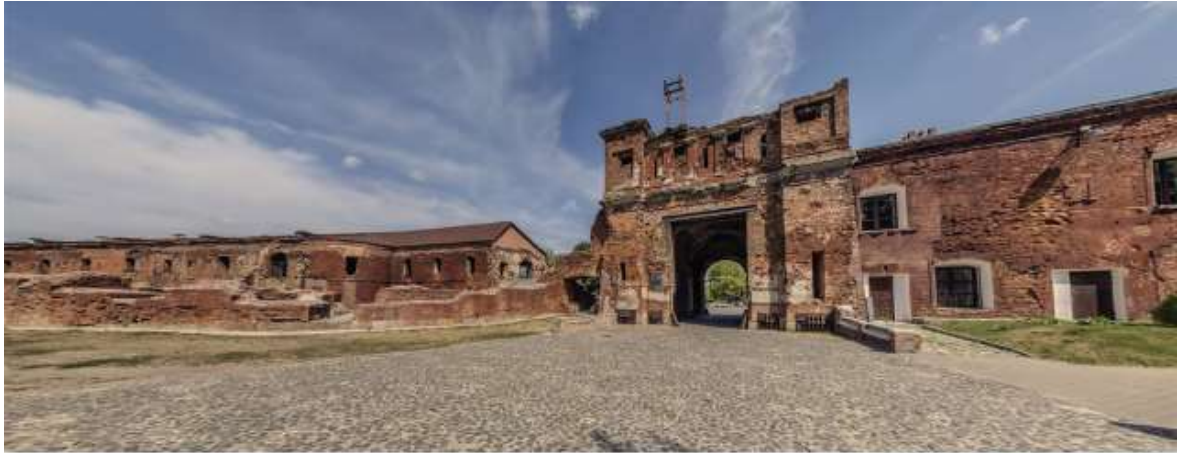
ВНЕШНИЙ ФАСАД ТЕРЕСПОЛЬСКИХ ВОРОТ. ВИД С ПРАВОГО БЕРЕГА Р. ЗАПАДНЫЙ БУГ.