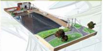
ПРОЕКТ ЧУПСП «АРМИГ» И ООО «ЭКОМОСТ». МОСТ ВОССОЗДАЕТСЯ ПО СОСТОЯНИЮ НА 1914 ГОД, НАБЕРЕЖНАЯ — ПО СОСТОЯНИЮ НА 1939 ГОД, ВОРОТА — ПО СОСТОЯНИЮ НА АВГУСТ 1941 ГОДА