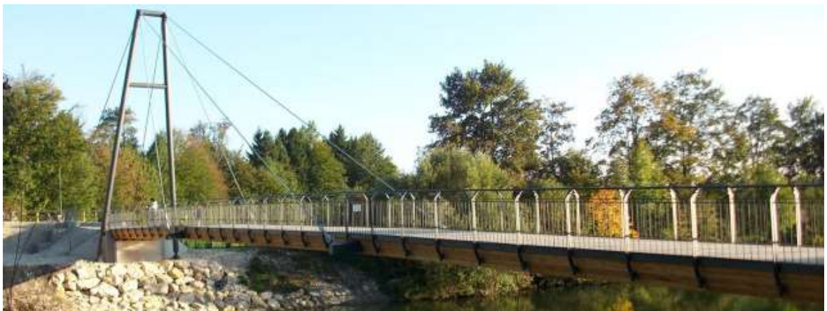
WOLFRATSHAUSEN, ГЕРМАНИЯ ЧЕРЕЗ РЕКУ LOISACH