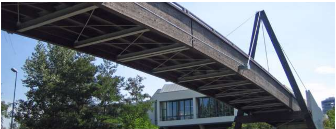
УЛИЦА TRIPPSTÄDTER В ГОРОДЕ KAISERSLAUTERN, ГЕРМАНИЯ