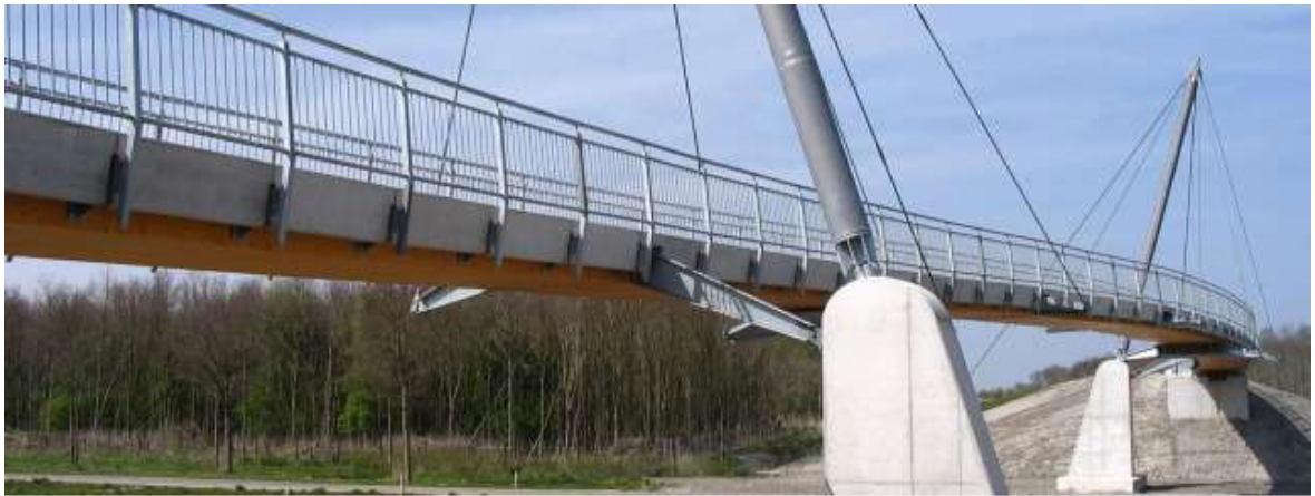
ALMERE, НИДЕРЛАНДЫ ПЕРЕСЕКАЕТ ОЖИВЛЕННУЮ ТРАССУ В ЗАПОВЕДНИКЕ