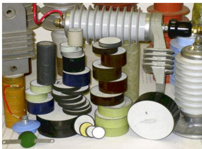
Рисунок 3. Внешний вид мощных варисторов

Работу варистора в статическом режиме характеризует номинальное сопротивление R_c при определенном значении приложенного напряжения U_x .