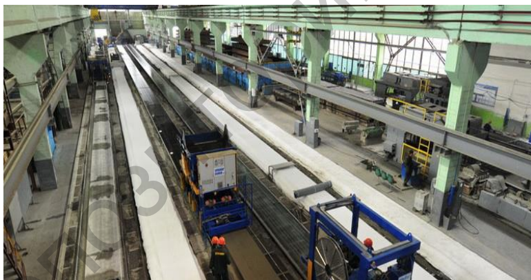
Рис. 4 – Формовочный цех ОАО «Гомельжелезобетон»

В 2008 году в ОАО «Гомельжелезобетон» проведена масштабная реконструкция производства плит пустотного настила с переходом на инновационную технологию безопалубочного формования как наиболее энергосберегающую с установкой новой технологической линии «Weiler Italia». Реализация проекта позволила увеличить на реконструируемых площадях выпуск плит пустотного настила и на 5 % сократить потребление энергоресурсов.