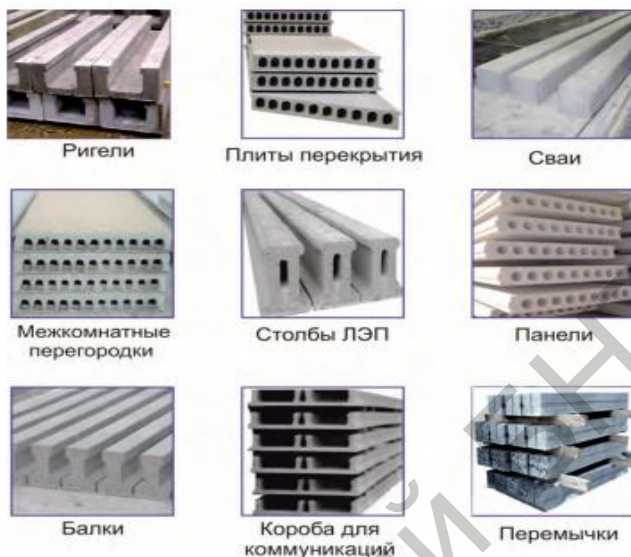
Рис. 3. Номенклатура изделий

Основные ограничения – высота и ширина изделия. На сегодняшний день минимальная высота изделия при виброформовании – 60 мм. В зависимости от выбранного типа оборудования, максимальная высота изделия составляет 300, 400, 500 или 600 мм, а максимальная ширина – 1200, 1500 или 2000 мм.