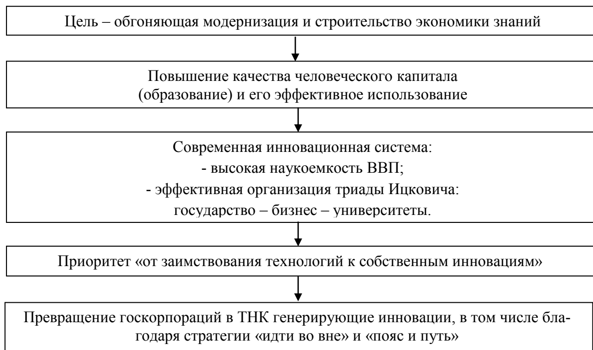
Рисунок 2 – Китайская модель механизмов государственного регулирования структурными изменениями в экономике и строительства экономики знаний

Цель новой экономической политики – обгоняющая модернизация и строительство экономики знаний с помощью следующих механизмов (рисунок 2).