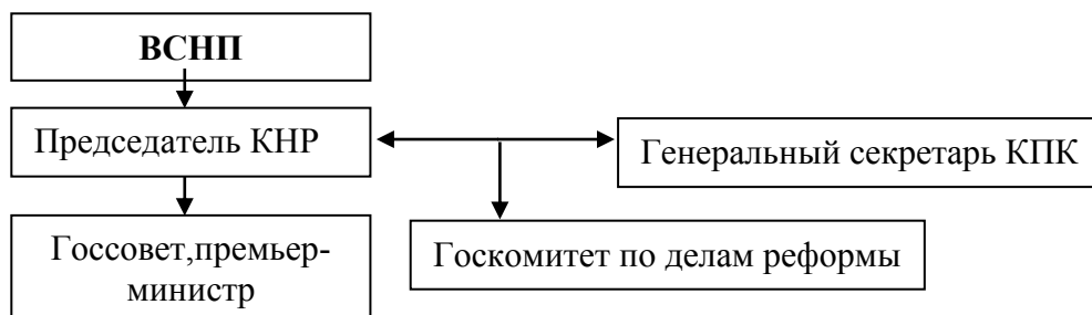
Рисунок 3 – Структура государственных органов власти Китая

Важно отметить, что в КНР члены Госсовета не могут занимать должности более двух сроков подряд. Исключительные полномочия Госсовета КНР – это функции регулирования и контроля социально-экономических процессов через соответствующую организационную структуру (рисунок 4), а также на основе административных мероприятий и нормативных правовых актов.