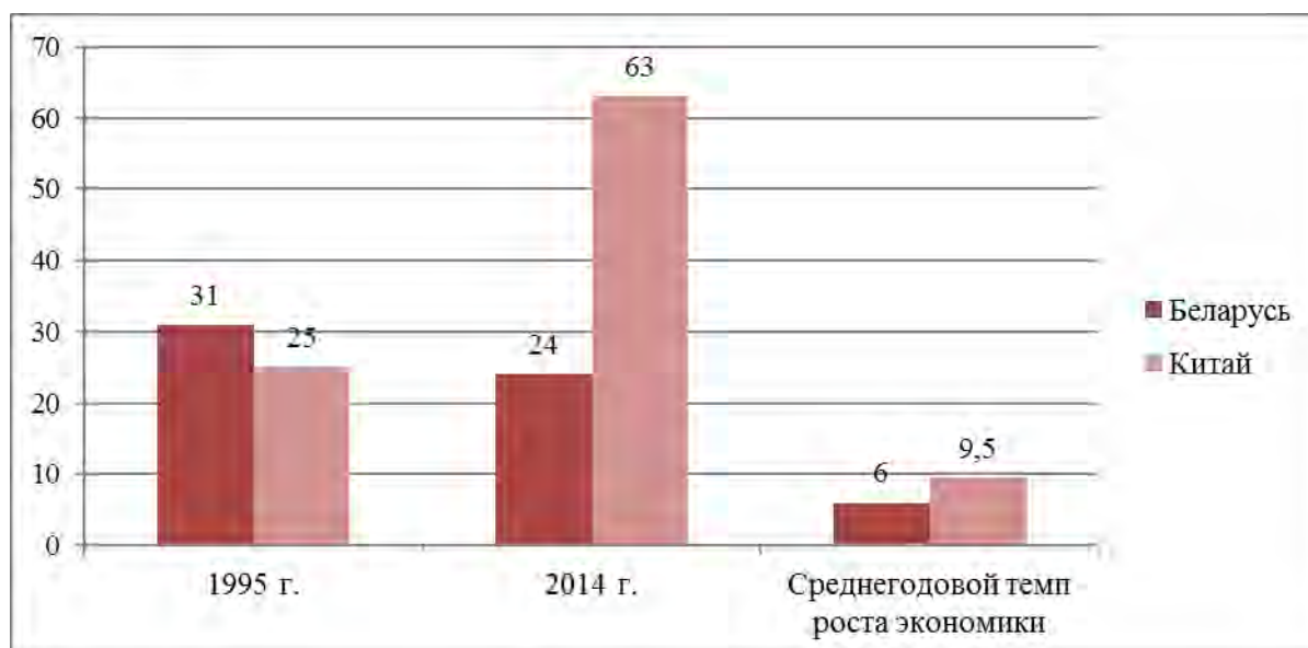
Рисунок 6 – Показатели динамики доли частного сектора и роста ВВП Китая и Беларуси за 1995-2014 гг., %

Источник: составлено автором на основе данных МВФ