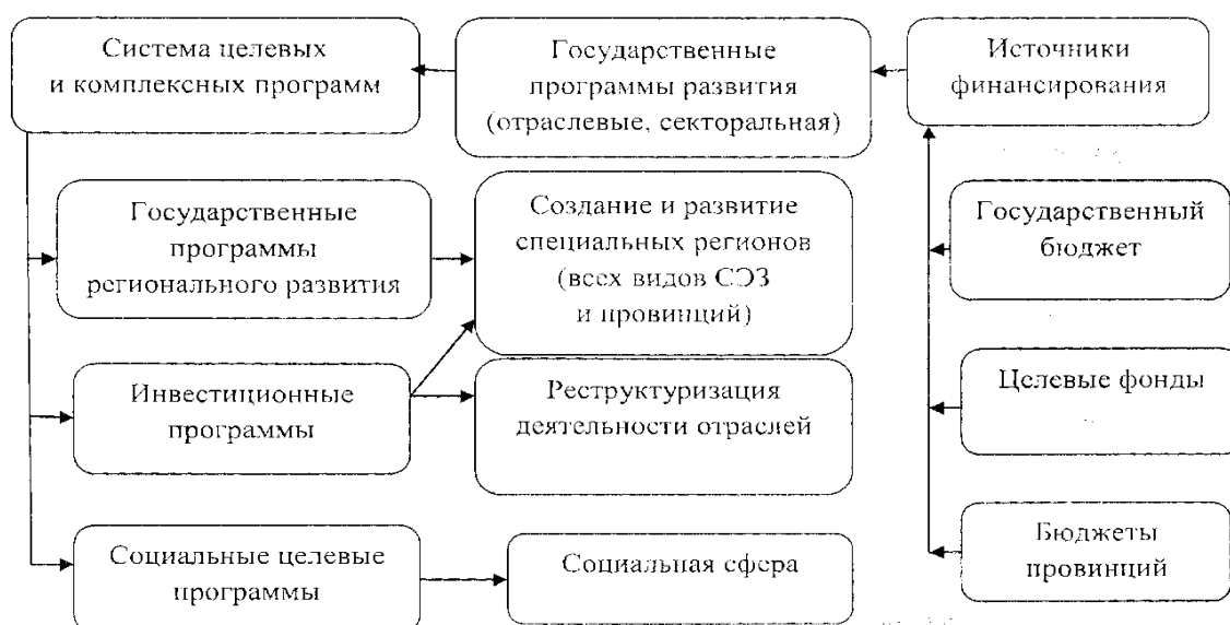
Рисунок 5 – Модель государственных долгосрочных программ, определяющих экономическую политику Китая