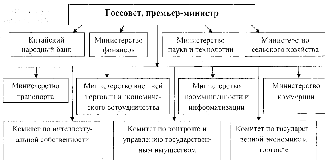
Рисунок 4 – Правительственные органы регулирования экономических процессов в Китае