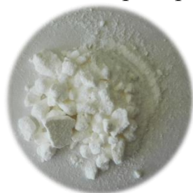
Рисунок 2 – Внешний вид бетулина-экстракт

Возможно применение после доочистки, предлагаемого бетулина-экстакта: