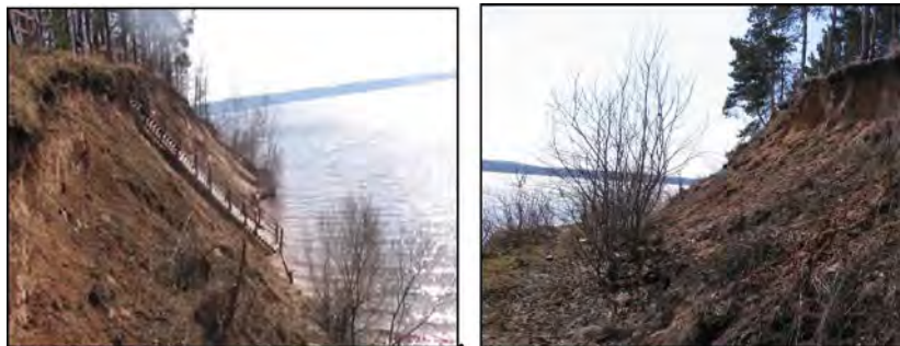
Рис. 1. Переработка берегов Лепельского и Заславского водохранилищ

абразионно-эрозионных процессов на водных объектах и незащищенных откосах подпорных сооружений с оценкой масштабов их проявления, необходимых для принятия инженерных мероприятий по уменьшению убытков от разрушения объектов экономики. Вероятность аварий на гидросооружениях имеет тенденцию роста. Учитывая период эксплуатации водохранилищ Республики Беларусь, считается, что к 2016 г. около 50% водных объектов и их ГТС превысит нормативный срок эксплуатации, составляющий более 40 лет, вследствие чего, возрастет вероятность их повреждения. Для Беларуси проблема эксплуатации «бесхозных» водохранилищ, возникла наиболее остро после развала СССР и аварии на Чернобыльской АЭС.