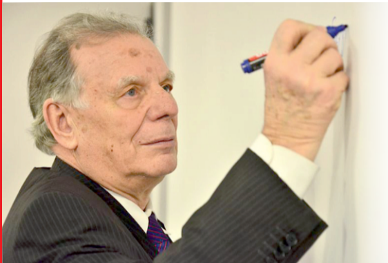
Академик Ж.И. Алфёров

Дорогие первокурсники! Достоинство пройдя все испытания, вы поступили в БНТУ — один из престижных вузов нашей страны. Среди его выпускников немало выдающихся ученых, известных руководителей предприятий, государственных деятелей. Все они достигли таких высот благодаря упорному неустойчивому труду с первого дня обучения в университете. Надеемся, что учеба в университете будет наполнена напряженным творческим трудом, новыми знаниями и открытиями. Поставьте перед собой конкретную цель и действуйте!