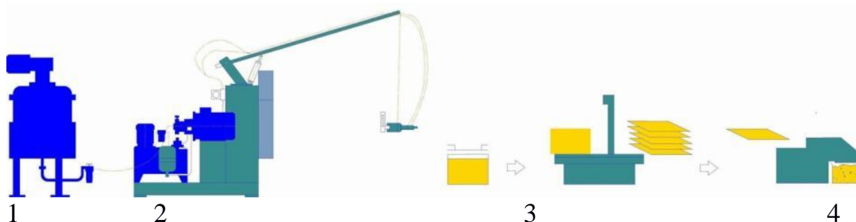
Рисунок 1. - Состав комплекса оборудования для производства сорбента Пенопурм ®

В работе представлен автоматизированный комплекс оборудования для производства изделий из сорбента Пенопурм ® (рисунок 1). В состав комплекса входят: смесительно-дозировочная установка высокого давления (1), формы для получения сорбента в виде блоков (2), установка для резки блоков на пластины (3), установка для продольной и поперечной резки пластин на крошку(4).