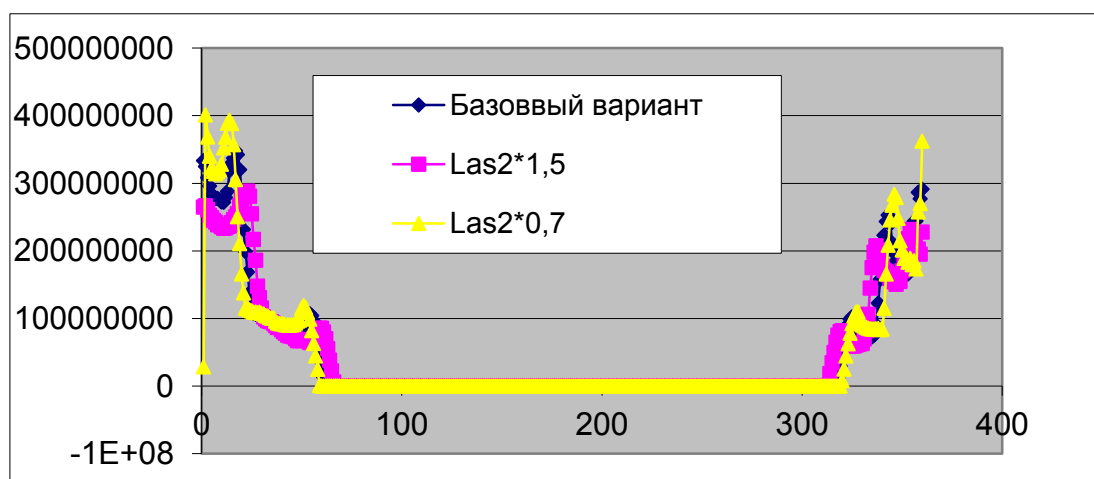
Рис. 2. – Изменение суммарных контактных давлений на элементах поверхности шатунной шейки в зависимости от положения центра масс шатуна

Установлено, что уменьшение показателей нагруженности и относительного износа шатунной шейки коленчатого вала имеет место при увеличении расстояния от оси шейки до центра масс шатуна. Одной из целей дальнейших исследований является анализ влияния изменения положения центра масс шатуна при увеличении/уменьшении его массы на нагруженность звеньев.