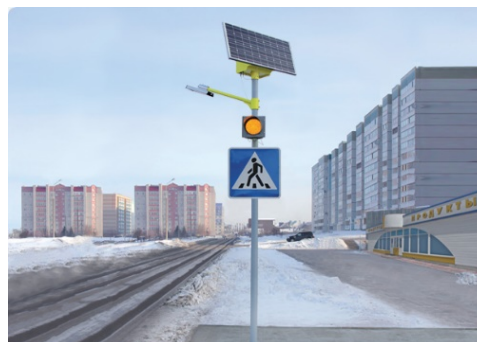
Рисунок 1 – Автономное освещение пешеходного переходы

В таких случаях используется минимальное количество оборудования. Как правило, это солнечный модуль, крепление модуля, ящик для хранения оборудования, контроллер заряда, АКБ, автоматы, провода, коннекторы.