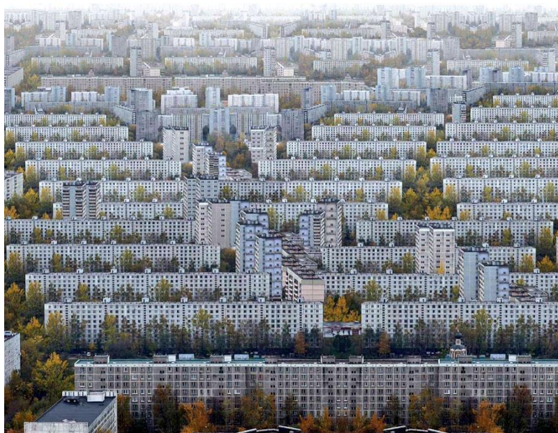
Рисунок 3 - Панельная застройка 50-70 годов

Такое однообразие и по сей день объединяет жилую среду застройки периода 50-70 годов (рис.3).