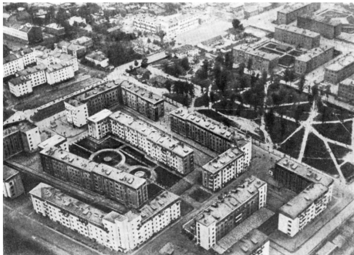
Рисунок 2 - Жилая застройка 30-ых годов

Так, на территории СССР со второй половины 30-х годов в кварталах (5-6 га), двор был довольно компактным и замкнутым. Школы размещались внутри отдельных кварталов и были рассчитаны на обслуживание населения еще нескольких прилегающих кварталов. Поэтому дети вынуждены по пути в школу пересекать улицы с большим движением городского транспорта, а детские дошкольные здания, располагаясь внутри дворов, часто занимали всю их территорию (Рис. 2).