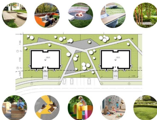
Рисунок 4 - Организация дворового пространства

Таким образом, важными составляющими процесса возникновения социального взаимодействия в дворовых пространствах является рациональное использование архитектурно-пространственных границ. А также создание комплекса читаемых и интерпретируемых на всех уровнях символов, существенных для возникновения максимально эффективно структурированной среды, которая лишена конфликтов и одинаково комфортна для каждого проживающего в ней человека вне зависимости от его возраста, социального статуса, ментальных особенностей.