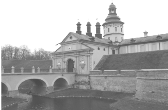
Рис. 1. Общий вид въездных ворот замка в Несвиже

торый соотносился с античной архитектурой, а не его барочное переложение, более соответствующее времени переустройства замка. Это свидетельствует о целенаправленном использовании элементов классицистической архитектуры, присущей просвещенному потомку сарматов.