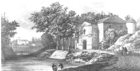
Рис. 4. Общий вид дворца Сапегов в Высоком

Заключение. В белорусской архитектуре позднего барокко первой половины XVIII века распространение классицистических элементов и деталей не вылилось в значительное художественное явление, а ограничилось в основном архитектурной практикой художественного двора Радзивиллов. Связано оно было с влиянием идей просвещенного сарматизма, а свое претворение получило благодаря творчеству местных мастеров, которые по указанию заказчиков строительства заимствовали классицистические темы из ар-