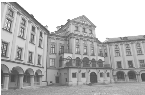
Рис. 2. Общий вид главного корпуса замка в Несвиже со стороны двора

То же композиционное построение стало основой архитектурной организации фасада главного корпуса замка при его перестройке. Здесь оно было исполнено в более плоскостной трактовке, характерной для стиля рококо, насыщено обильным лепным декором с включением изображений воинской атрибутики (рис. 2).