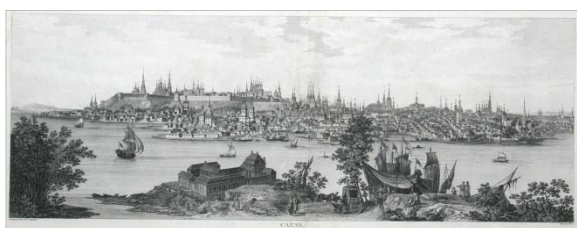
Рис. 2. Вид Казани в 1767 г. [5; 7, с. 5]

нет посадских стен. Однако посад с рассыпанными по его холмам и стелющимися у подножия Кремля деревянными домами отражает его состояние в последние 30 лет. Среди преимущественно деревянной жилой застройки возвышались кирпичные церкви в стиле русского узорочья и с мотивами барокко. Гребни холмов на посаде подчеркивали высотные объемы церквей и колоколен Николая Гостиного, Петра и Павла, Воскресенской. Такую пространственную структуру имела Казань в середине XVIII в.