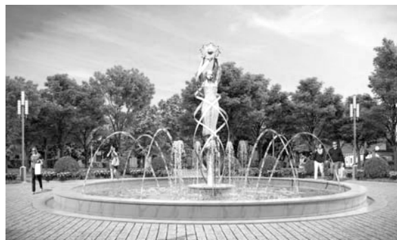
Рис. 4. Оформление зоны отдыха

ном дизайне, соответствующем стилистике застройки площади. Разработан индивидуальный дизайн торшера с современными светодиодными светильниками, его стилистика перекликается с застройкой площади, но в то же время светильник не имитирует старинные образцы и имеет современную архитектуру.