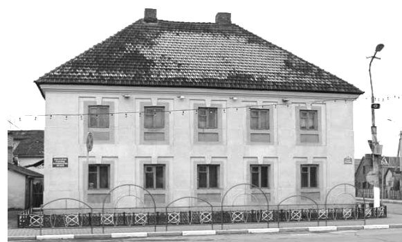
Рис. 1. Исторические здания на пл. Ленина в г. Поставы (существующее состояние)

Главной архитектурно-градостроительной проблемой современных Постав является необходимость реконструкции площади Ленина, имеющей: