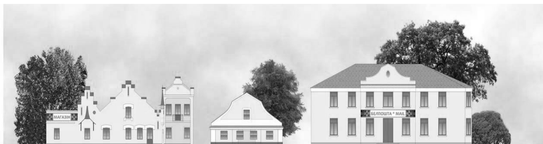
Рис. 2. Цветовое решение существующей исторической застройки (проектные предложения)

Концепцией предлагается единое цветовое решение всей периметральной застройки площади (исторической и поздней) при ограниченном разнообразии цветового решения кровель. Предусмотрено также единое рекламное решение всех торговых и общественных предприятий с использованием национальной орнаментики в вывесках, единого шрифта (рис. 2).