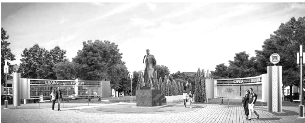
Рис. 3. Оформление торжественно-мемориальной зоны

2. Зона отдыха включает создание фонтана «Радзіма-Пастаўшчына», увеличение пешеходной зоны на 437 м 2 за счёт проезжей части, устройство мест отдыха и дополнительное озеленение (рис. 4).