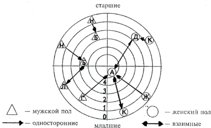
Рисунок 2 – Социогамма-мишень, изображающая взаимоотношения в группе из 11 человек

Второй тип групповой социогаммы – социогамма мишень (рисунки 2) – представляет собой систему концентрированных окружностей, количество которых равно максимальному количеству выборов, полученных в группе.