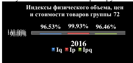
Рисунок 3 – Индексы физического объема, цен и стоимости, абсолютная убыль стоимости товаров группы 72.

Таким образом, убыль стоимости импорта была получена частично за счет падения цен и частично за счет падения физического объема (рис. 3).