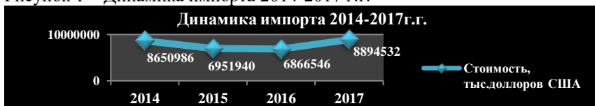
Рисунок 1 – Динамика импорта 2014-2017 г.г.

Для проведения анализа импорта Республики Беларусь индексным методом были собраны данные о количестве и стоимости импортированных товаров товарных позиций, входящих в товарные группы 27, 72, 73. Эти данные были представлены в бюллетенях Государственного таможенного комитета Республики Беларусь «Таможенная статистика внешней торговли Республики Беларусь» [5-6].