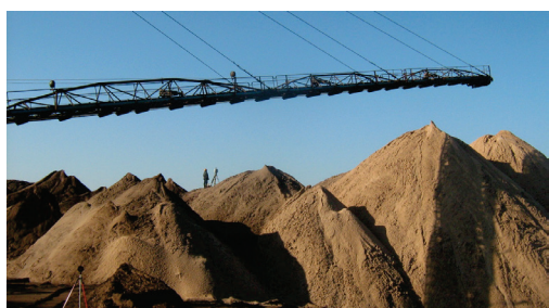
Рис. 1. Солеотвалы. Использование лазерного сканера Leica ScanStation C10 для создания цифровой модели рельефа

В целях охраны окружающей среды и сохранения земельных угодий разработан и используется способ высотного складирования галитовых отходов в солеотвалы (рис. 1). На сегодняшний день они заметны за многие километры и представляют собой красноватые горы, достигающие в высоту 120–150 м.