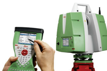
Рис. 2. Лазерный сканер Leica ScanStation C10

рядка сантиметра) и область съемки, затем запускает процесс сканирования. Для получения полных данных о солеотвале выполняются аналогичные операции с нескольких станций (позиций), обеспечивающих полный обзор солевых отвалов. Результаты съемки со всех станций вводятся в компьютер, «сшиваются», и таким образом получается полная цифровая модель солеотвала.