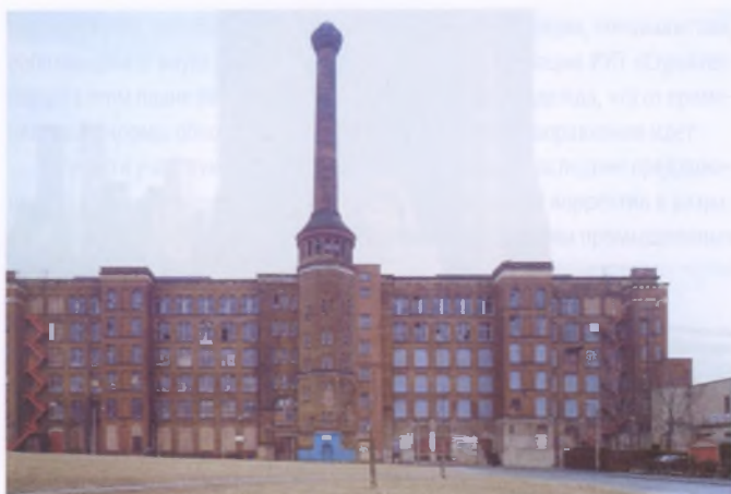
Памятники промышленной архитектуры Англии и Германии

одинаковые семена, почву, освещение, приемы агротехники. Лично я отношусь именно к таким невезучим натуралистам-ботаникам. Какое-то есть биополе у человека, которое может способствовать росту растений или наоборот. Тем не менее думаю, что материальная основа этого явления со временем станет известной и понятной, но будут существовать необъясненными еще многие другие такие же загадочные явления.