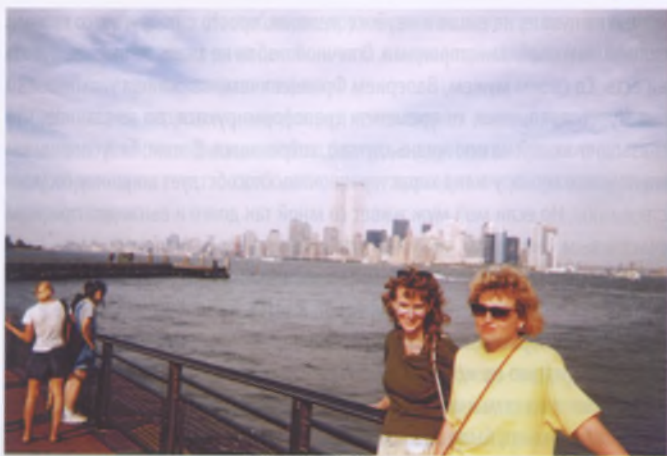
США '1998 г.