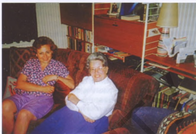
Высшая архитектурная школа в Оксфорде. Англия 1993 г.

Е. Б.: Не задумывалась о том, люблю ли путешествовать. Поездила много и продолжаю это делать, была и неоднократно во многих городах Европы и даже США, но это все не путешествия, а разные научные поездки: конференции, конкурсы, семинары, научные стажировки. Видеть новые места, встречать новых людей и общаться с ними; узнавать новое всегда интересно, но можно ли это назвать путешествиями, не знаю.