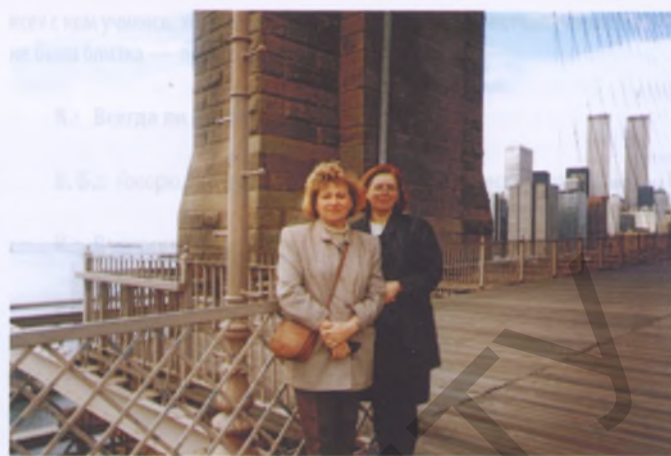
США '2002 г.