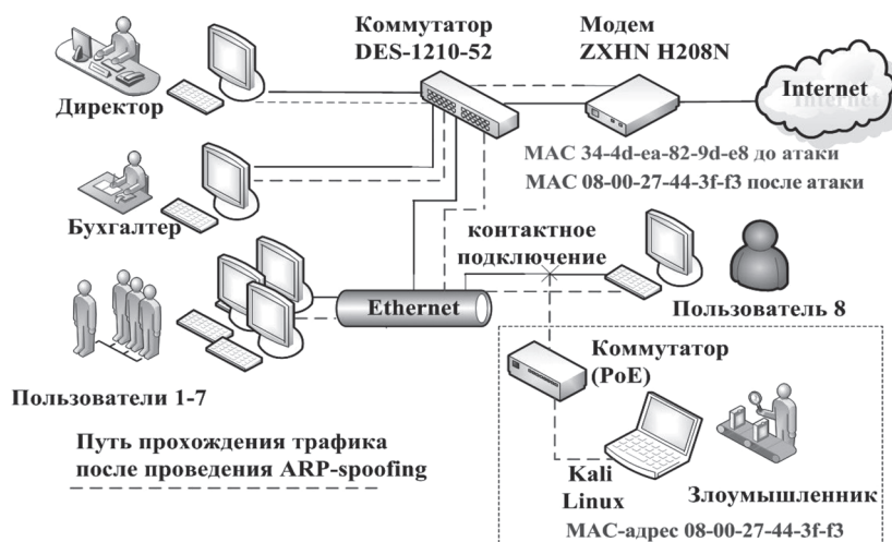
Рис. 3. Схема проведения атаки ARP-spoofing