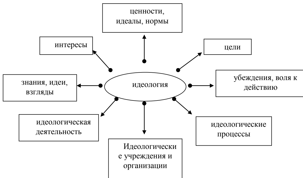
Схема 1. Структура идеологии

Система идеологии функционирует на основе процесса идеологического воздействия, который охватывает и представляет собой деятельность субъектов по производству, воспроизводству и практической реализации представлений, идей и ценностей. А.Е. Калинин предлагает классифицировать идеологические процессы на основании: