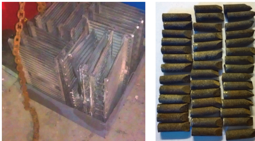
Рис. 3. Опытно-экспериментальные образцы литых заготовок вставок резцов