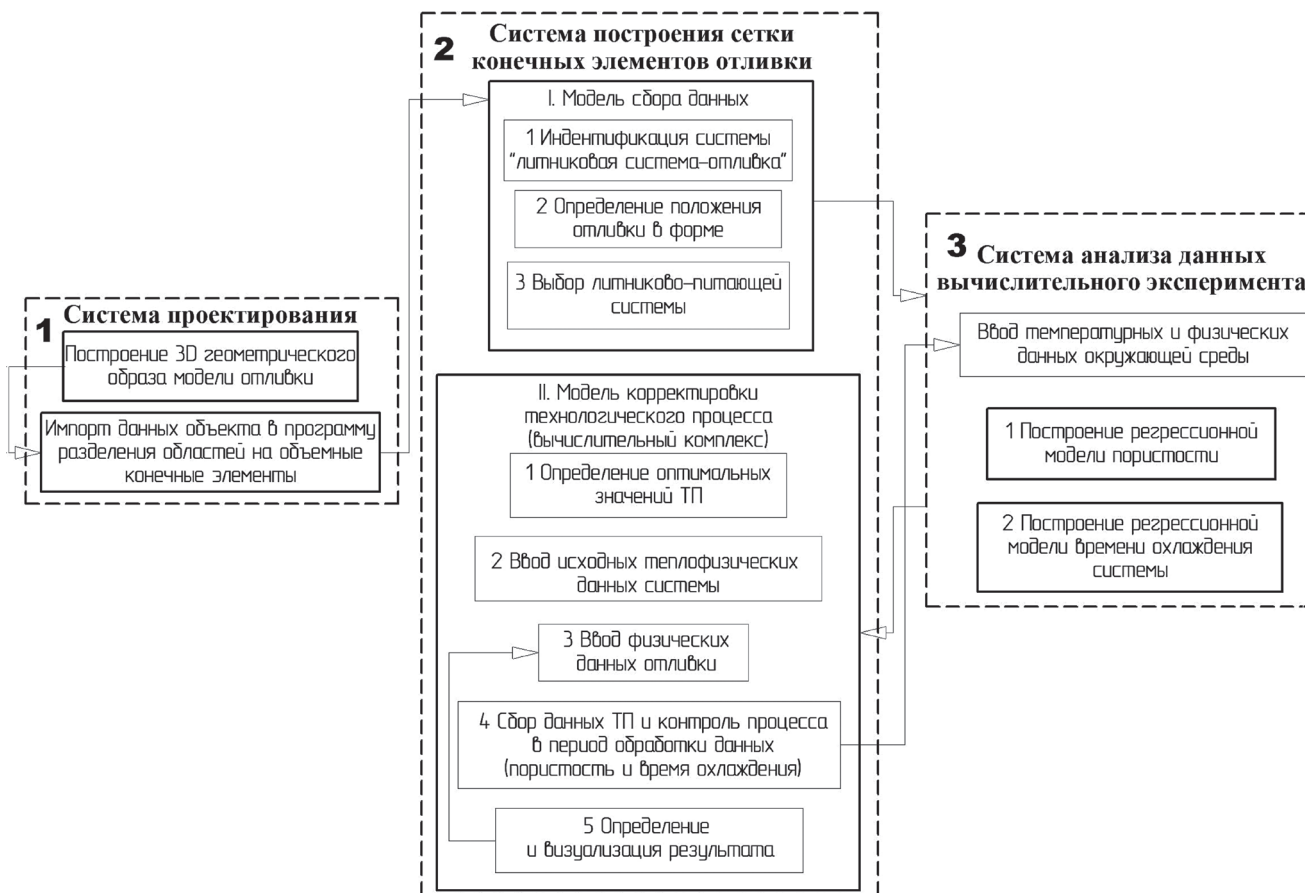
Рис. 1. Схема взаимодействия технологических модулей обеспечения вычислительного эксперимента

с учетом теплофизических характеристик исследуемых материалов. На основании проведенного анализа определяются коэффициенты регрессии, которые формируются в программной среде. После выполнения анализа результатом являются: