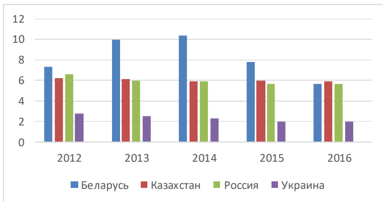
Рисунок 1. Доля строительства в ВВП в 2012-2016 гг. в отдельных странах мира [3]

Беларусь — малая открытая экономика. На реальный сектор и финансовую систему сильно влияют внешнеэкономические факторы. Так, например, основным внешним вызовом для белорусской экономики стал экономический спад в России, обусловленный низкими ценами на нефть и внешнеполитическими проблемами. Снижение экономической активности у наших торговых партнеров стало причиной сокращения внешнего оборота товаров и услуг.