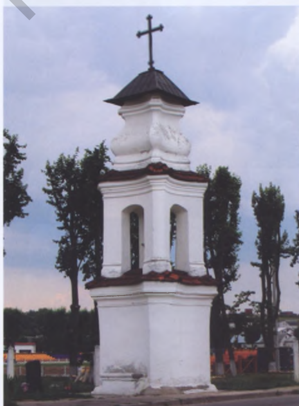
Рис. 12. Капличка Святого Доминика в Слониме. 1745 год