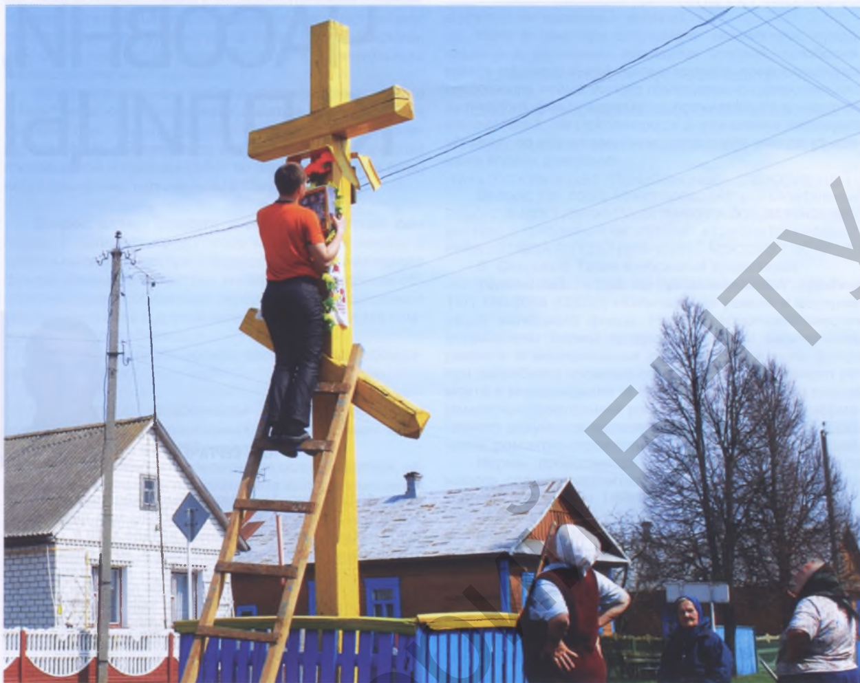
Рис. 3. Приготовление к Пасхе в Мотоле Ивановского р-на. Апрель 2013 г.