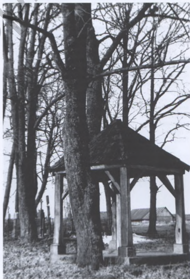
Рис. 6. Каплица в Груздово Молодечненского р-на. Фото 1979 года