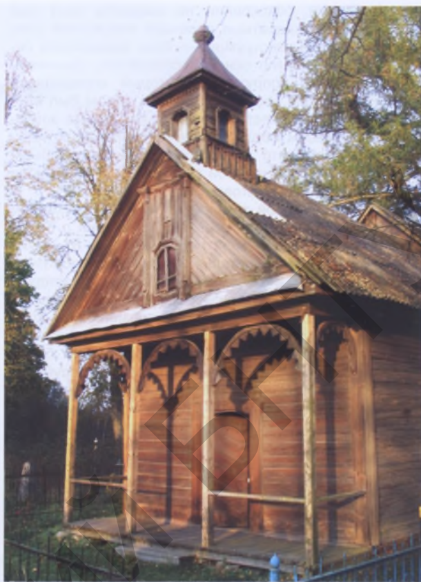
Рис. 9. Каплица в Шабунях Пуховичского р-на

пространственной организации интерьера создавали хоры, которые иногда делали над входом, — колонны, поддерживавшие хоры, ведущая наверх лестница (Липнишки Ивьевского р-на, XVIII век). Эти элементы позволяли использовать архитектурный декор в формах колонн, резьбе досок ограждения хора, в профилировке поручней хора и лестницы.