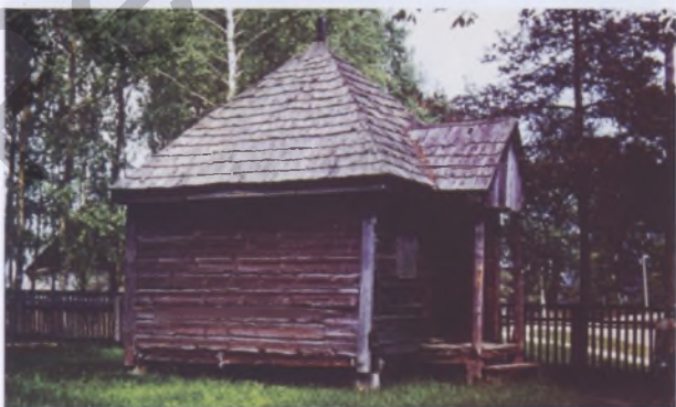
Рис. 8. Каплица в Огородниках Слуцкого р-на. Фото 1978 года

работ. Поэтому те каплицы, как правило, сохранили свои первичные формы и образы почти без изменений. Это обстоятельство, а именно первозданность их архитектурного образа, придает этим сооружениям особую