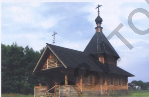
Рис. 17. Часовня – памятник Св. Благоверных князей Бориса и Глеба, памяти воинов, погибших на полях Первой и Второй войны в Забродье Вилейского р-на. 2006 год