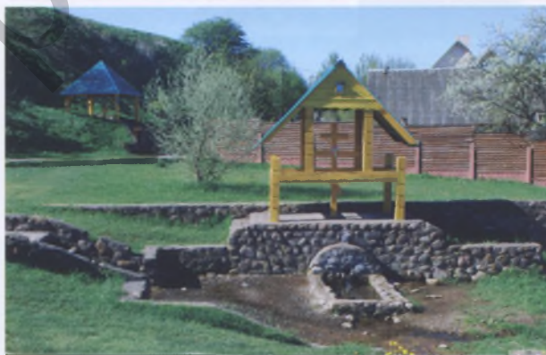
Рис. 19. Часовня во имя преподобного Мартина Туровского и криница у «Замковой горы» в Копыле