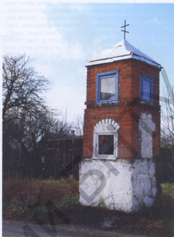
Рис. 14. Каплица в Колодчино Вилейского р-на