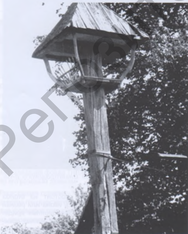
Рис. 4. Каплица в Великих Столпенятах Островецкого р-на. Фото 1980 года

упоминавшимся летописцем XI века Нестором, культовым обычаем восточных славян радимичей и кривичей устанавливать высокие столбы, накрытые маленькой крышей, под которой хранилась урна с прахом умерших. В формах этих каплиц шатер крыши мог быть основным, определяющим элементом, а мог оставаться лишь прикрытием главного — «латарни», выполненной в виде своеобразного, широко открытого проемами, украшенного резьбой ящичка с иконой или фигурой святого, чаще с распятием (Великие Столпенята Островецкого р-на — рис. 4–5.)