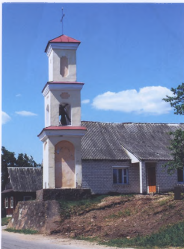
Рис. 13. Каплица в Гольшанах Ошмянского р-на. XVIII век