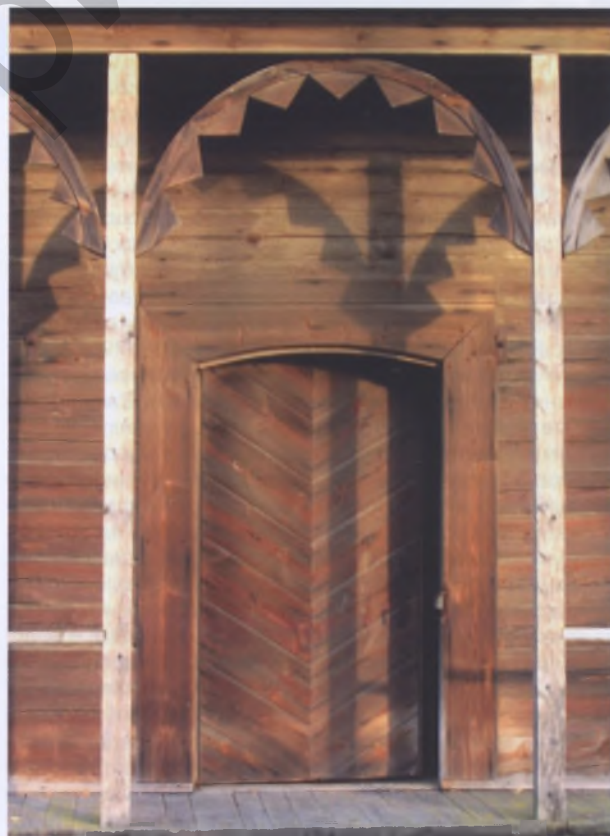
Рис. 10. Каплица в Шабунях Пуховичского р-на

Простота конструкций и небольшие объемы здания значительно облегчали выполнение ремонтных