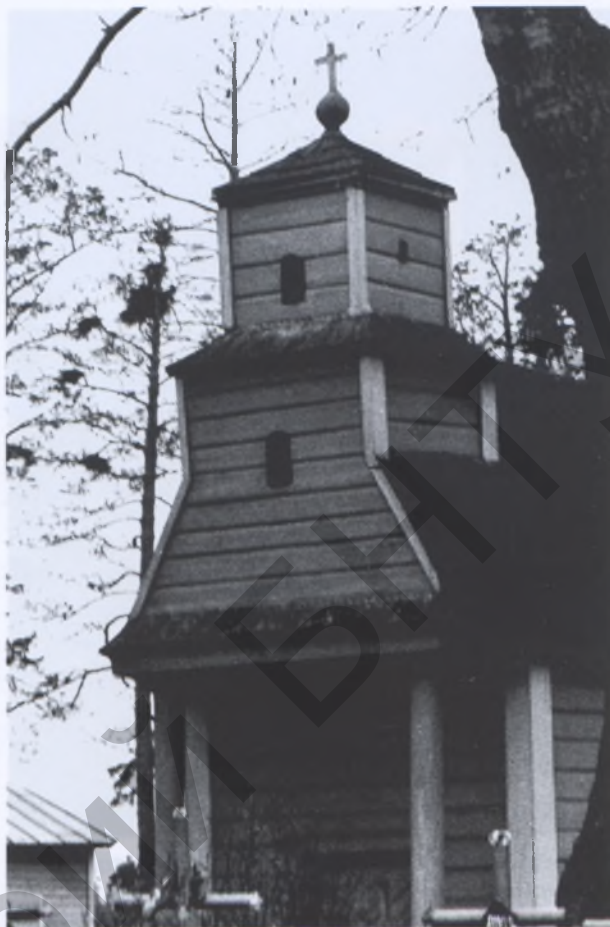
Рис. 11. Капличка в Острошицком городке Минского р-на. XIX век

Строительство капличек осуществлялось сообща, а это позволяло привлечь к работам лучших в округе мастеров. Настоящий, уважающий себя мастер не мог отказаться от участия в такой работе, понимая, что это позволит и себя показать, и повысит его авторитет как строителя, и поможет оставить о себе хорошую память. Надо полагать, существенным было и то, что участие в таких работах позволяло приобщиться к созданию духовных ценностей, высоко ценимых людьми творческих профессий, и, кроме того, было важной стороной духовной жизни самого строителя. Неслучайно высокая историко-художественная ценность капличек и труднозаменяемость их для исторического ландшафта Беларуси содействовали возрождению этого типа сооружений в наше время: Ободовцы и Забродье Вилейского р-на (рис. 17), на «Буйничском поле» в Могилеве (рис. 18) и др.