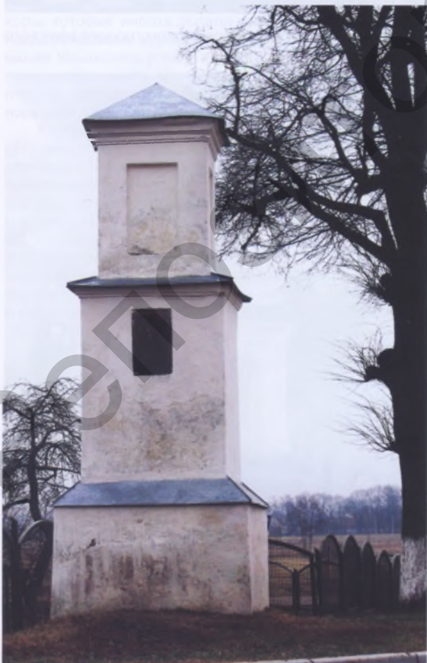
Рис. 15. Каплица в Несвиже

Архитектура каплиц всегда сохраняла самобытные черты местного зодчества, их конструктивные и художественные особенности были аналогичны простейшим постройкам в крестьянских усадьбах. Это относится и к каменным каплицам (Добровляны Сморгонского, Городец Шарковщинского, Осингородок Поставского р-нов и др.). Лишь в помещичьих имениях, обычно в парковой зоне, недалеко от дворца, возводили каплицы, в формах и декорации которых воспроизводились мотивы классической архитектуры (Летешин Клецкого р-на, XIX век) с попытками воспроизводства, порой скрупулезного, в дереве элементов каменного зодчества (руст, колоннады, карнизы и др.).