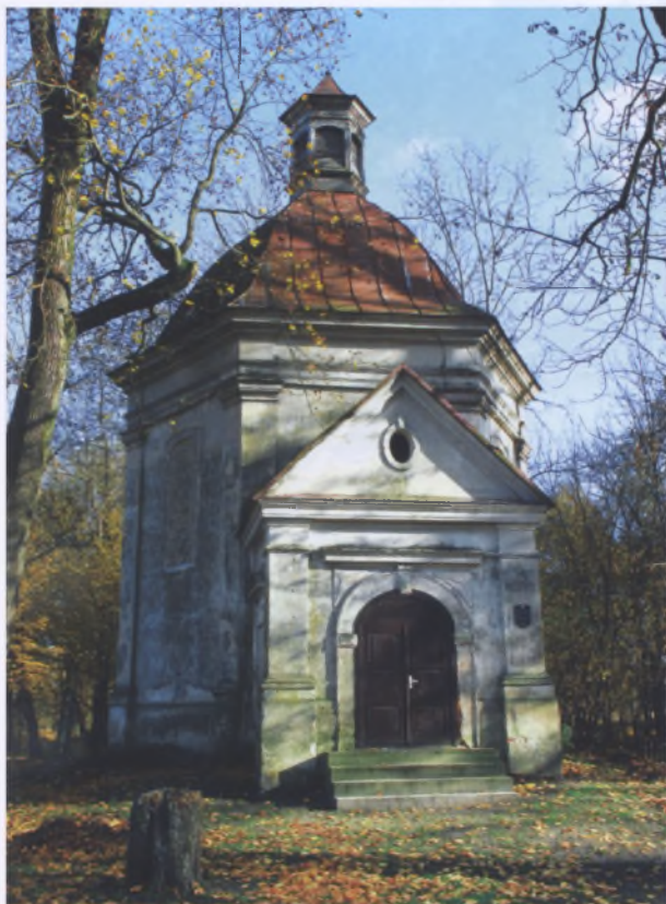
Рис. 16. Часовня Воздвижения Креста Господня в Дубое Пинского р-на. Середина XVIII – первая половина XIX века