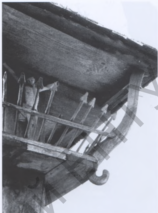
Рис. 5. Каплица в Великих Столпнятах Островецкого р-на. Фото 1980 года

Иконостас в каплицах обычно не делали. Окна небольшие по размерам, чаще прямоугольные по форме, реже — с криволинейным завершением. Но встречались круглые окошки (Ошмяны, XIX век), стрельчатые (Жодишки Сморгонского р-на, XIX век), в виде поставленного на угол квадрата (Королевцы Вилейского р-на, XIX век), полукруглые (каменная каплица в Мостах Правых Мостовского р-на, XIX век). Потолок — плоский (подшивной либо в виде настила по балкам). Хотя известны и достаточно оригинальные решения (Королевцы), где центральной структуры зал перекрывается дощатой конструкцией, имитирующей достаточно сложные по формам каменные своды. Некоторое усложнение