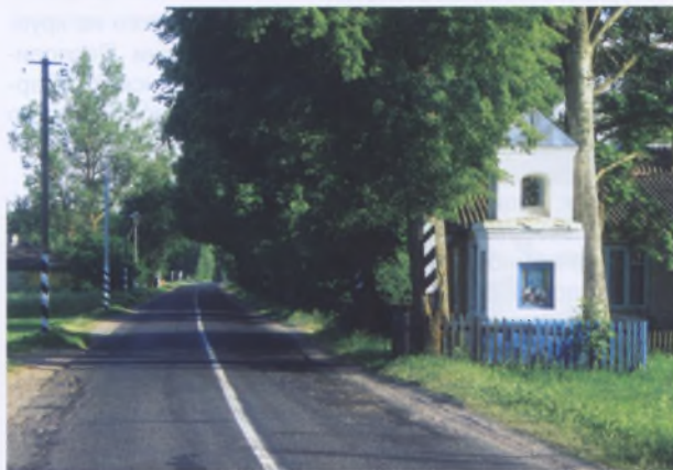
Рис. 20. Каплица в Расло Сморгонского р-на