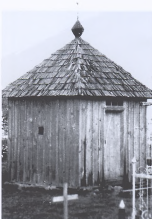
Рис. 7. Каплица в Копыле. Фото 1970 года