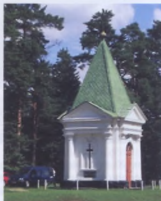
Рис. 1. Часовня в Салтановке Могилевского р-на. 1912 год

Часовенки («каплицы») — простые культовые соору- жения небольшого объема, были одной из наиболее своеобразных особенностей белорусских пейзажей. Служба внутри или около них проводилась только в определенные дни и праздники или только по опре- деленным случаям [1, с. 125]. В Беларуси и сейчас их можно обнаружить у околицы небольшой деревни, на перекрестке дорог, около храма, очень часто — на клад- бище. В период, когда атеистическая идеология доста- точно агрессивно проявляла себя относительно храмов, многим капличкам удалось уцелеть. Более того, эти соору- жения, которым прежде отводилась вспомогательная роль, стали более значимыми, помогая многим заполнить возникший вакуум в организации духовной жизни [2, с. 367].