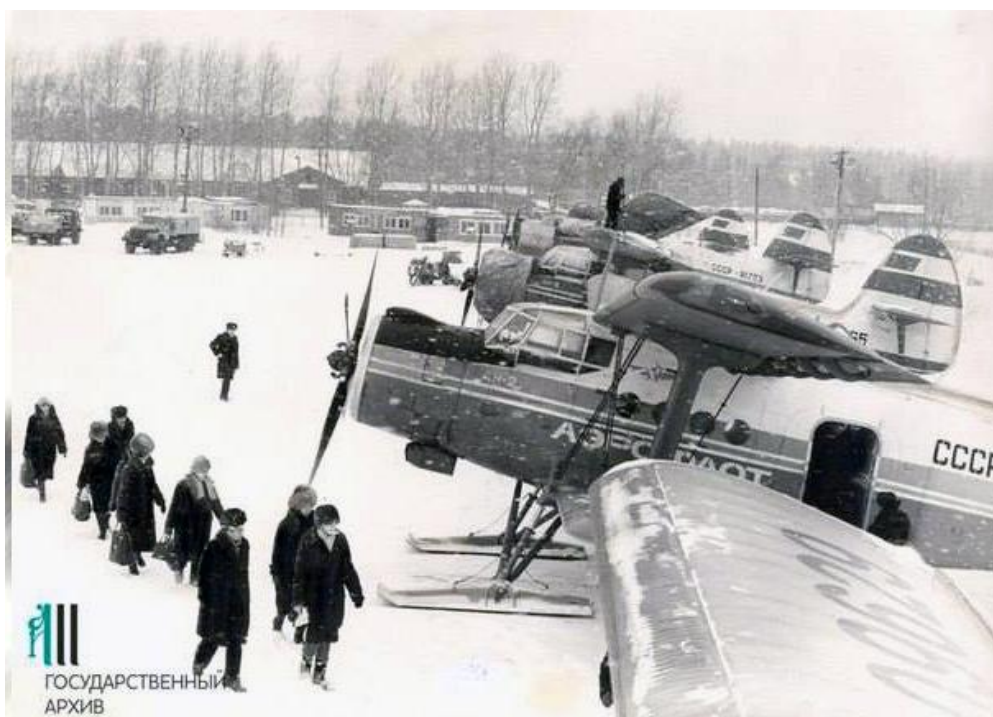
Рисунок. 8 – Аэропорт «Бахаревка». [2]

Строительство началось с устройства двухкилометровой взлётно-посадочной полосы с твердым покрытием. Первый рейс Ил-18 Екатеринбург – Москва – Пермь приземлился 16 февраля 1965 года. Так начал свою работу новый аэропорт Перми «Большое Савино». Аэровокзал построили только в 1967 году. Он был выполнен из бетона и стекла по типовому проекту, прослужив до строительства нового терминала в 2017 году. С открытием нового авиапредприятия география воздушных перевозок значительно увеличилась, так же как и парк авиатехники. С ростом авиаперевозок встала необходимость о разделении авиаотряда на два предприятия. Был образован Пермский объединённый авиаотряд (аэропорт «Большое Савино») и Второй Пермский объединённый авиаотряд (аэропорт «Бахаревка») [3].