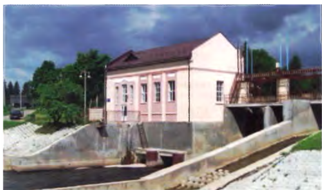
Рис. 22. Гидроэлектростанция в Тетерине Круглянского района

приверженного к эффектности колонного портика, и принципов архитектуры итальянского Возрождения. Между тем это здание, впечатляющее монументальностью форм, даже не упоминается в истории белорусской архитектуры. И краеведческая литература умалчивает об архитектуре 1950-х гг. Но даже без требования упоминать о них в учебниках и книгах по архитектуре можно отметить присутствие в застройке самых разных поселений сооружений, неизменно привлекающих внимание своими формами и деталями, непривычными для нашего времени: вокзал в Кричеве, малые ГЭС в Тетерине Круглянского или в Клястицах Россонского районов и др. (рис. 21–23). Высокие щипцы торцовых стен, карнизы в виде поясков, пилястры (Тетерин), полукруглое окно с обрамлением и «замковым камнем» (Клястицы), рустованная штукатурка с развитыми карнизами (ГЭС в Чигиринке Кировского района), арочные проемы (ГЭС в Рачунах Сморгонского района) – рудименты архитектуры послевоенного десятилетия, в течение которого