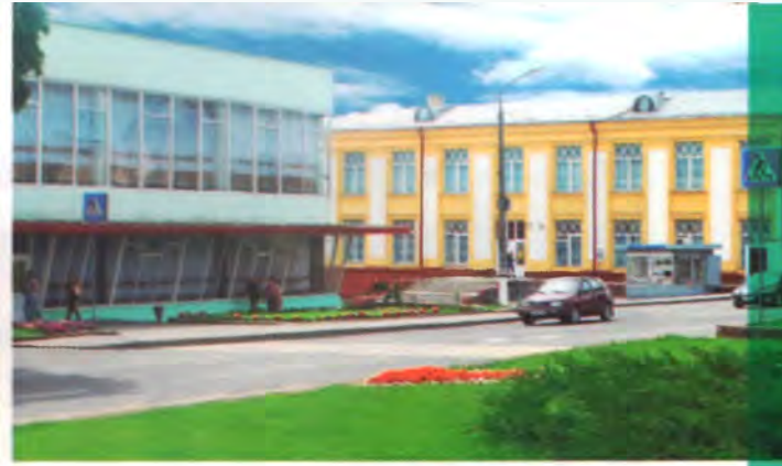
Рис. 5. Универмаг в Копыле