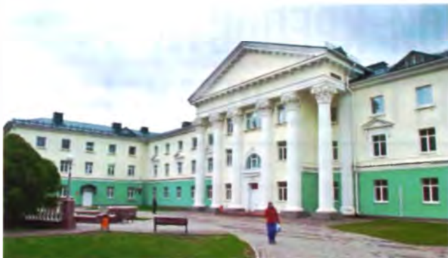
Рис. 20. Лечебно-диагностический корпус Лепельского военного санатория