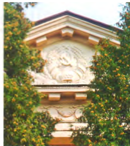
Рис. 7–10. Кривичская участковая больница (бывшее здание райкома КПБ и райисполкома).