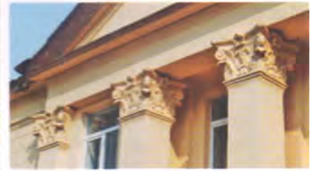
Рис. 14–17. Клуб в Кривичах