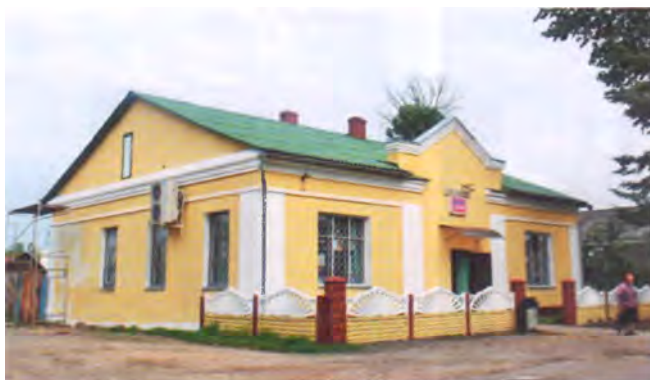
Рис. 18. Магазин на площади поселка в Кривичах

Конечно, такими постройками не исчерпывается весь пласт интересных объектов белорусской архитектуры, расположенных в небольших населенных пунктах, но характеризующихся разумно решенными функциональными вопросами и обладающими высокими художественными достоинствами. Среди них можно назвать лечебно-диагностический корпус Лепельского военного санатория (рис. 20) – синтез мотивов архитектуры русского классицизма,