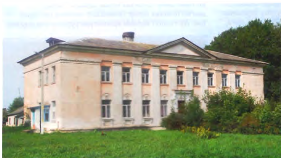
Рис. 11–13. Здание бывшей школы в Кривичах Мядельского района

Часть клуба вдоль главного фасада двухэтажная, с размещением на