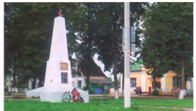
Рис. 19. Памятник советским воинам и партизанам в Кривичах