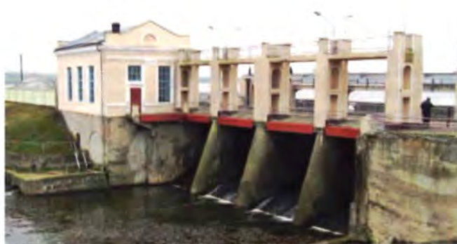
Рис. 23. Гидроэлектростанция в Клястицах Россонского района