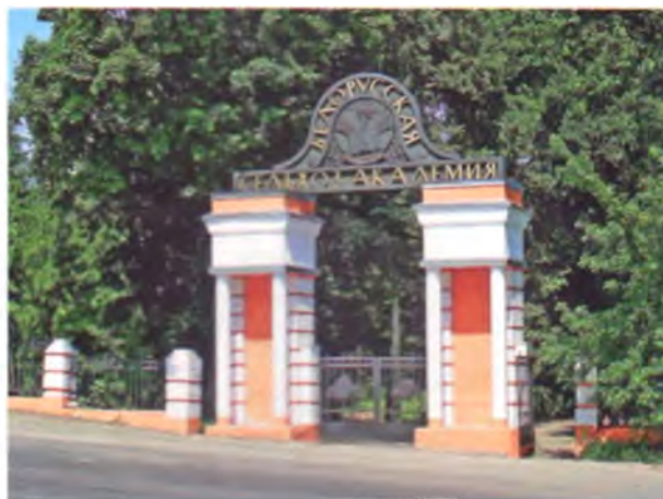
Рис. 3. Парадный вход на территорию академического городка. Архит. С. Беляев