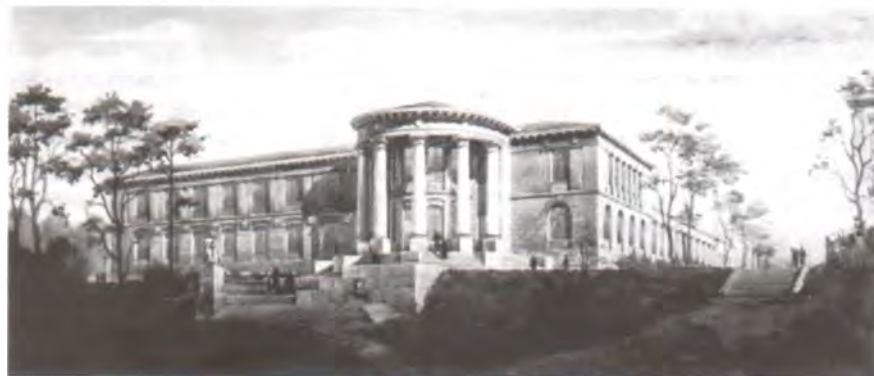
Рис. 1. Проект корпуса факультета механизации Белорусской государственной сельскохозяйственной академии в Горках. Архит. С. Беляев, С. Мусинский

1950-е гг. были необычайно интересным временем в архитектуре. Переосмысление классического наследия позволило создать выразительные и гармоничные центры городов. При этом многие новые общественные и жилые здания все чаще возводились по типовым проектам, в чем уже просматривались технологии будущего. Но все же эстетика архитектурных решений превалировала над конструктивно-технологической основой. В творческом арсенале зодчих сохранялся такой важный элемент, как архитектурная деталь. Некоторым сооружениям этого периода повезло