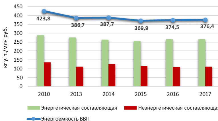
Рис. 3. Энергоемкость ВВП по составляющим (ВВП в ценах 2005 г.)

ВВП было достигнуто за счет модернизации оборудования, внедрения современных энергоэффективных технологий, увеличения доли использования местных ТЭР и возобновляемых источников энергии.