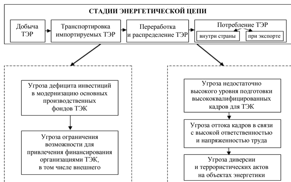
Рис. 2. Общие угрозы энергетической безопасности Республики Беларусь на всех стадиях энергетической цепи (собственная разработка на основании [4])