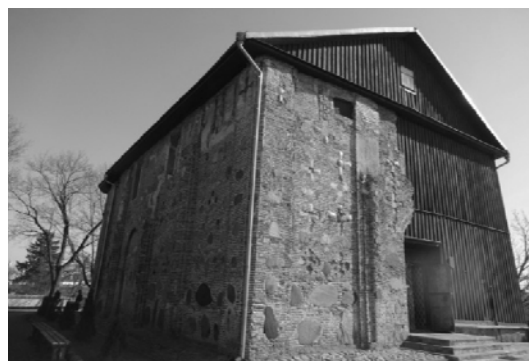
Рис. 2. Церковь Святых Бориса и Глеба на Коложе в Гродно: вид с северо-западной стороны аутентичного оставшегося фрагмента фасада храма. Фот.Е.Устинович, 2015

Предлагаю четыре категории архитектурных и конструкторских действий, и именно: