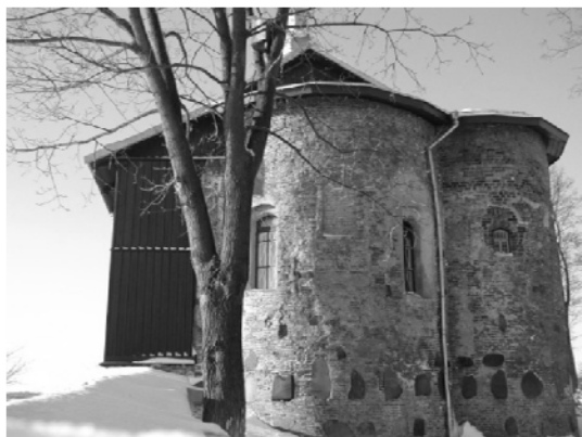
Рис. 3. Церковь Святых Бориса и Глеба на Коложе в Гродно: вид с восточной стороны аутентичных фрагментов алтарных апсид храма. Фот. Е. Устинович, 2005

южной стены церкви – относящейся к XIX веку – подпорной стены (рис. 1);