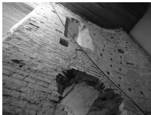
Рис. 5. Церковь Святых Бориса и Глеба на Коложе в Гродно: современный, внутренний вид северной алтарной апсиды храма.

– современная реконструкция литургическо-пространственной структуры, относящейся к XII веку, в материалах и технологиях, родных по отношению к использованным при воссоздании прежних элементов структуры стен.