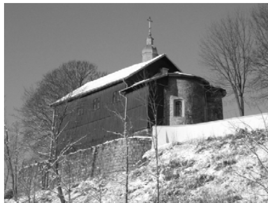
Рис. 1. Церковь Святых Бориса и Глеба на Коложе в Гродно. Общий вид храма с юго-восточной стороны, с видом подпорной стены.

выражением современной интерпретации истории, на уровне современных вдохновений и веры, в стремлении продолжения Традиции?