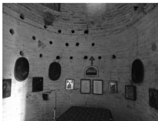
Рис. 6. Церковь Святых Бориса и Глеба на Коложе в Гродно: современный, внутренний вид оставшихся фрагментов южной алтарной апсиды храма. Фот. Е. Устинович, 2015

И в итоге необходимо сказать следующее. Мы должны использовать последний шанс эклезияльного действия людей компетентных в этих делах, людей идейно связанных, несмотря на государственные, политические и административные разделения, несмотря на границы. Для всей православной общины гродненская церковь Святых Бориса и Глеба является одним из животворящих источников духовной жизни, их веры — свидетельством