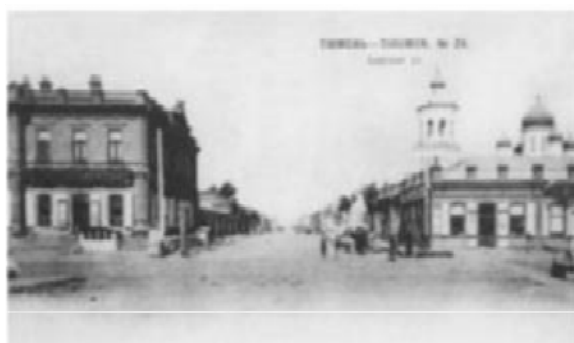
Рис. 6. Усадьба Колмаковых по ул. Царской – Галицынской (совр. ул. Республики – Первомайская), фотография 1901 г., из книги Копылова В.Е. Былое Светописи

Торговые дома. Дом из комплекса усадьбы по ул. Царской (совр. ул. Республики, 44) в городе Тюмени наиболее яркий образец в таком типологическом ряду, как «торговый дом» – новый тип здания, появившийся в связи с активным экономическим развитием на рубеже XIX – XX вв.: особенностью этого типа являлось то, что первый этаж, как правило, занимали торговые помещения, второй этаж – помещения конторы, жилище хозяина или управляющего (рис. 6).