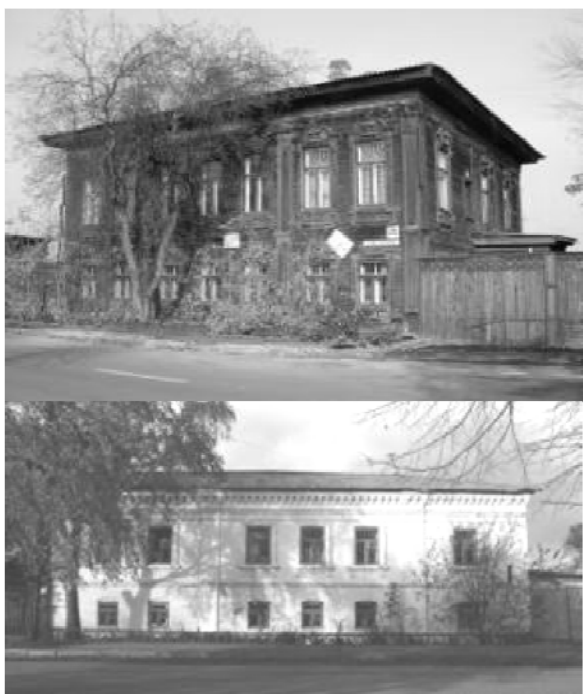
Рис. 5. Дом и флигель усадьбы купцов Колмаковых по ул. Ильинской (совр. ул. 25 Октября) в г. Тюмени

Торговые дома. Дом из комплекса усадьбы по ул. Царской (совр. ул. Республики, 44) в городе Тюмени наиболее яркий образец в таком типологическом ряду, как «торговый дом» – новый тип здания, появившийся в связи с активным экономическим развитием на рубеже XIX – XX вв.: особенностью этого типа являлось то, что первый этаж, как правило, занимали торговые помещения, второй этаж – помещения конторы, жилище хозяина или управляющего (рис. 6).