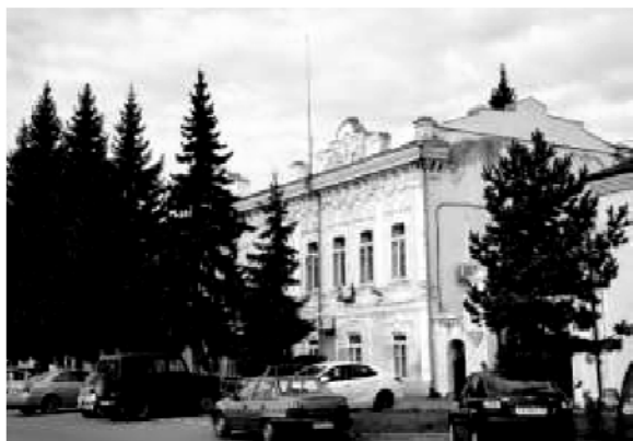
Рис. 2. Усадьба Колмаковых в г. Ялуторовске, фотография Клименко А.И., 2018 г.

Каменное здание в два этажа с подвалом, построенное в эклектичной манере, фиксирует угол квартала, ограничивающего бывшую торговую площадь Ялуторовска, и оказывает значительное влияние на формирование центра города (рис. 2).