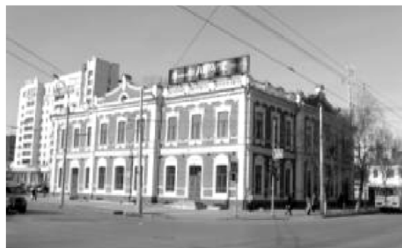
Рис. 8. Усадьба Колмаковых по ул. Царской - Галицынской (совр. Республики - Первомайская), фотография Клименко А.И., 2006 г.

высокими двухстворчатыми дверями. С западной стороны между выступами лестничных блоков располагался балкон, как указано в экспликации к архивным планам, на железных столбах. Весь подвальный этаж был отведен под складские помещения. Особо интересным является решение по организации загрузки товаров в подвальные помещения. Часть помещений в западной части загружались со двора по лестнице, расположенной под балконом. Большие помещения, расположенные под торговыми залами, загружались соответственно с улиц Царской и Галицынской через крупные арочные проемы с железными воротами, расположенными под каждым из уличных входов в торговые залы. Для спуска в подвал служили лестницы, устроенные вдоль фасадов и огражденные подпорными стенками (рис. 8).