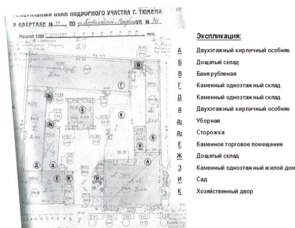
Рис. 7. Генеральный план подворного участка усадьбы г. Тюмени по ул. Галицынской - Царской, чертеж 1928 г.

выделена центральными полуциркулярными проёмами и высокими венчающими башенками. Декоративное убранство фасадов составляют: плоскостные наличники высоких лучковых окон с прямыми профильными сандриками; междуэтажный карниз с «сухариками»; рустованные пилястры и несложный венчающий карниз, поддерживаемый стилизованными кронштейнами. Завершают композицию фасадов аттиковые столбики с балюстрадой. Здание является локальным композиционным акцентом исторической застройки.