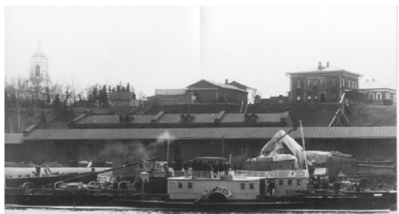
Рис. 4. Усадьба купцов Колмаковых по ул. Ильинской (совр. ул. 25 Октября) в г. Тюмени, архив Клименко А.И.

оконный наличник, выполненный в технике объёмной резьбы, основным мотивом которой является растительный орнамент. В отличие от основного дома жилой флигель каменный, построен в 1913 г. и имеет лаконичный трехчастный прямоугольный объем. Окна первого этажа лишены наличников, окна второго этажа имеют штукатурные профили. В настоящее время используется только одно из зданий комплекса усадьбы – каменный флигель, сейчас там размещается гостиница (рис. 5).