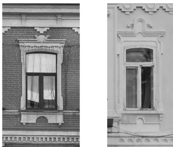
Рис. 3. Наличники домов купцов Колмаковых в г. Тюмени и в г. Ялуторовске, фотографии Клименко А.И., 2018 г.

В результате исследования характера карниза, наличников и их завершений, применение похожих архитектурных элементов таких, как центральный криволинейный аттик, угловые тумбы, аналогичные решения в декоративном оформлении пластики фасада, можно сделать вывод, что рассматриваемые особняки в Тюмени и в Ялуторовске имеют схожие принципы организации декоративного убранства (рис. 3). В свою очередь это позволяет сделать предположение о принадлежности объектов одному мастеру.