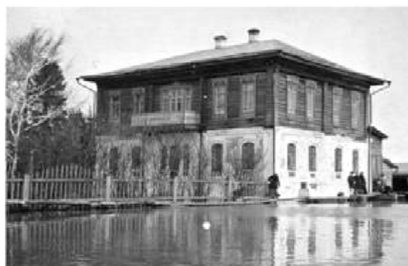
Рис. 1. Главный дом усадьбы Колмаковых в г. Ишиме, фотография 1912 г.

Жилые дома и усадьбы. Помимо крупных и значимых объектов из различных типологических групп, купеческой семье принадлежали усадьбы, расположенные в разных районах исторического центра Тюмени, Ялуторовска. Как ранее было сказано, интерес к объектам архитектурного наследия данной купеческой семьи заключается в своеобразии построек, отражающих специфику уклада заказчика, характерных особенностей периода строительства. Если объекты из усадебных комплексов в Тюмени и Ялуторовске имели более традиционное архитектурное решение для того времени, то объект, расположенный в пригороде - заимке города Ишима отражает сочетание традиционного крупного деревянного сельского жилого дома, поставленного на каменный цоколь на манер городского купеческого особняка - дом по ул. Пушкина, 10 в городе Ишиме (рис. 1).