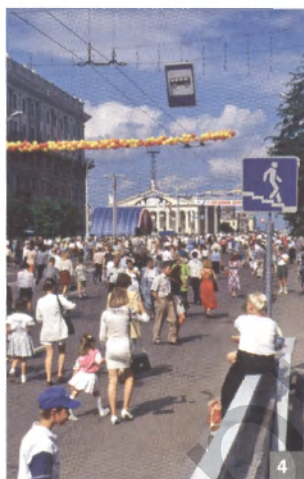
Рис. 4. Проспект Независимости в День города

Ресурсы спортивного туризма. Его развитие обусловлено наличием спортивных школ международного класса, спортивных школ, завоевавших признание на международном уровне. Даже не слишком значимые международные спортивные игры и соревнования вызывают приток туристов, для которых организуется торговля сувенирами, товарами туристского ассортимента с символикой соревнований, что приносит дополнительные доходы. Важно также наличие спортивных объектов, которые отвечают специальным требованиям, установленным для проведения соревнований соответствующего ран-