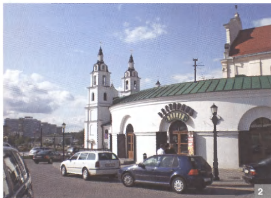
Рис. 3. Питание в туризме рассматривается как неотъемлемая часть гостеприимства и знакомства с местной культурой. Троицкое предместье.