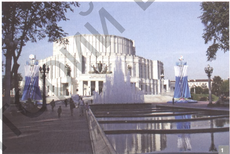
Рис. 1. У туристов более популярны те виды театрального искусства, которые не требуют перевода. Национальный академический Большой театр оперы и балета

Для выполнения необходимых расчетов обоснован и разработан ряд расчетных показателей, которые отсутству-