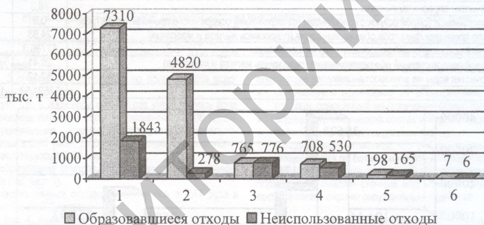
Рис. 1. Соотношение объемов образовавшихся и неиспользованных отходов производства различных видов в 2008 году (без учета галитовых отходов и глинисто-солевых шламов), тыс. т

* В 2008 году частично захоронены ранее накопленные отходы (осадки) водоподготовки котельно-теплового хозяйства и питьевой воды, очистки сточных, дождевых вод и использования воды на электростанциях