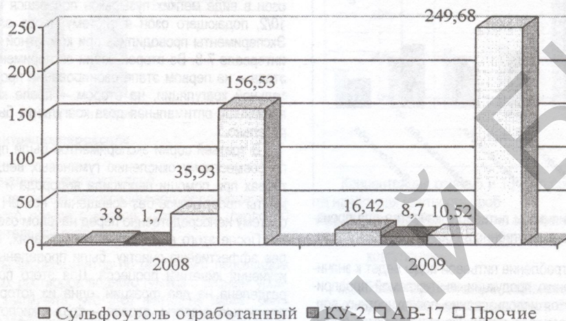
Рис. 4. Образование отходов, образующихся при умягчении воды на фильтрах в 2008 и 2009 годах

Из представленных данных видно, что объем образующихся отходов (зарегистрированных) в 2009 году в сравнении с 2008 годом уменьшился в 3,35 раза.