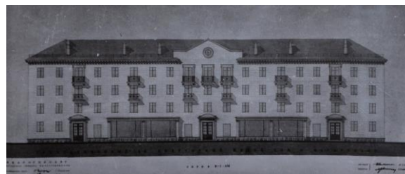
Рисунок 8 – Проект жилого дома серии №1-414 (2)

Янке Купале на родине в Радошковичах, поэту Якубу Коласу на московском кладбище.