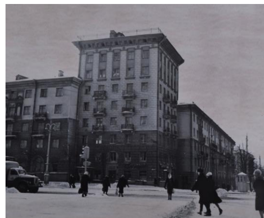
Рисунок 6 – Комплекс жилых домов полиграфкомбината