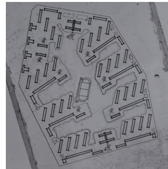
Рисунок 5 – Проект жилого микрорайона в Могилеве