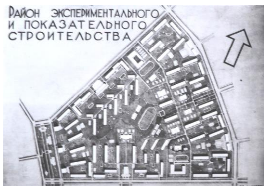
Рисунок 7 – Проект микрорайона по улице Волгоградской в Минске