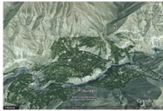
Рисунок 5 – Высокогорное поселение Оббурдон на высоте 1890 м. н. у. м. Горно -Матчинского района