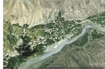
Рисунок 4 – Горное селение «Дашти Кози» у горных долин реки Зеравшан на отметке 1450 м н.у.м