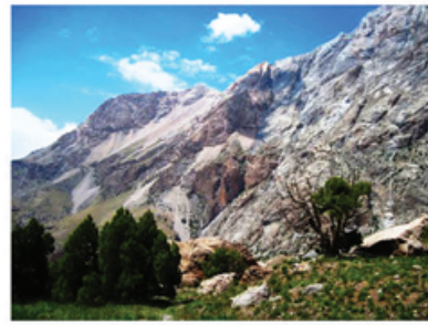
Рисунок 2 – Ландшафт высокогорного участка Таджикистана