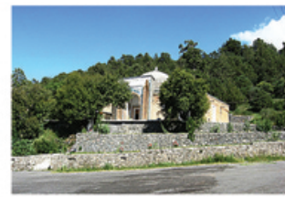
Рисунок 6 – Памятник IX в. в поселке Мазори Шариф джамоата Колхозчиён Пенджикентского района.