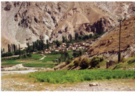
Рисунок 1 – Историческое горное селение Гизодара у Фанских гор